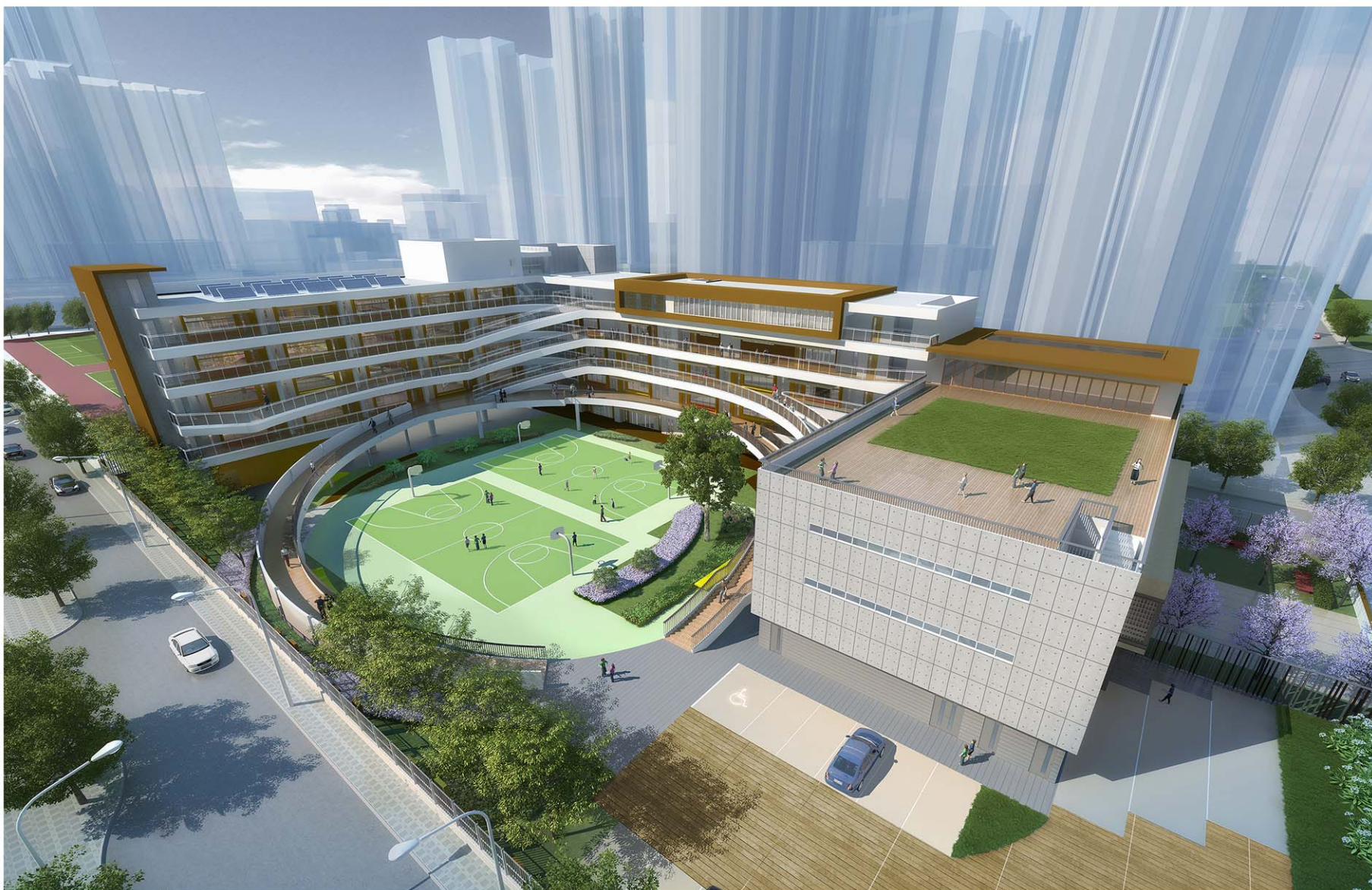
從南面望向小學的構思透視圖 PERSPECTIVE VIEW FROM SOUTHERN DIRECTION