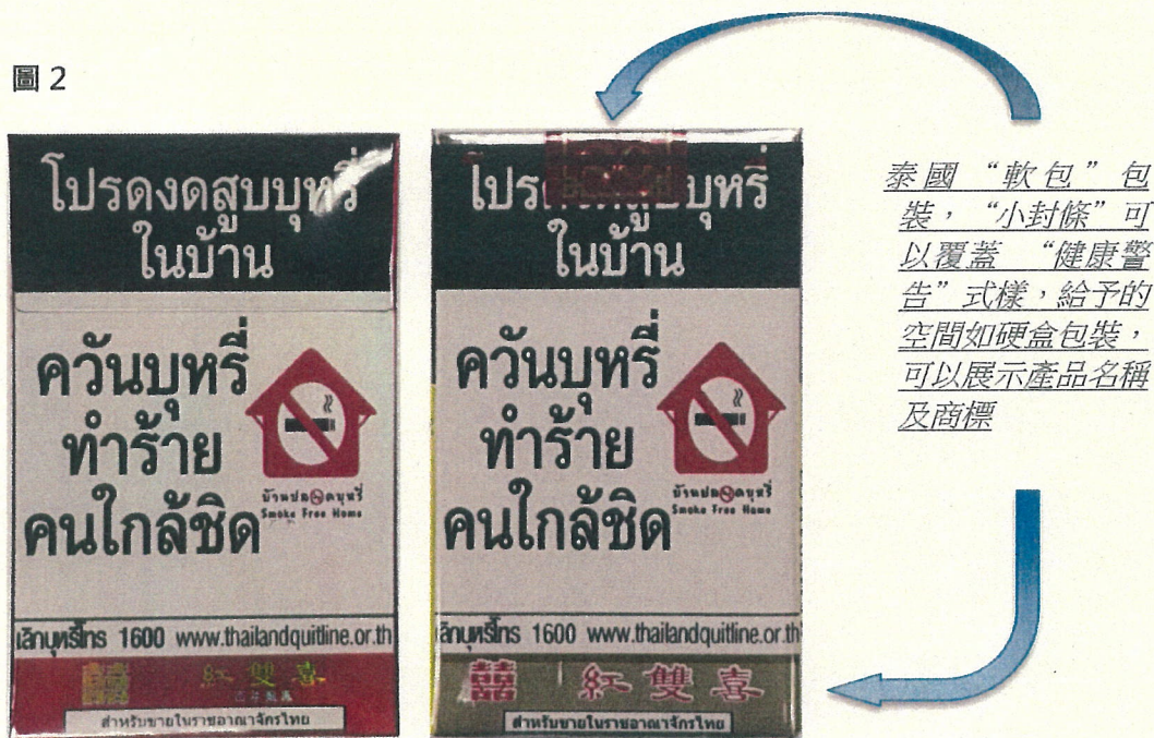
現行泰國“硬盒”包裝