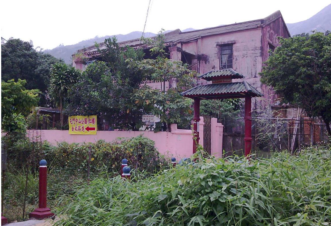
紅樓（攝於二零零九年）