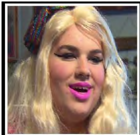
High School "Transgender" Boy with a history of sexually harassing female students Granted Anytime Access To Girls Restrooms.

這是個複雜的議題。按康貴華醫生的一篇文章，名為「一個性別不安症個案的處理」，跨性別認同(Cross – Gender Identification) 或性別不配合(Gender Nonconformity)有五個類別：(一個性別不安症的個案處理 www.tinyurl.com/hmconcern028 )