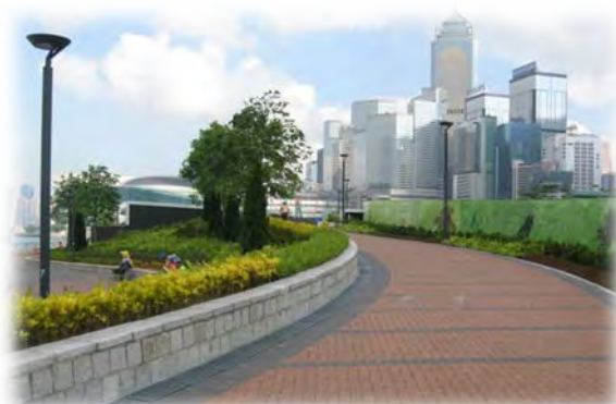
中西區海濱（中環段）