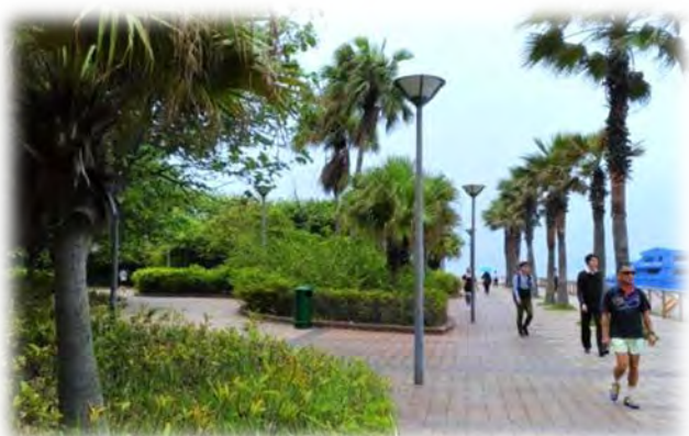
中西區海濱（上環段）