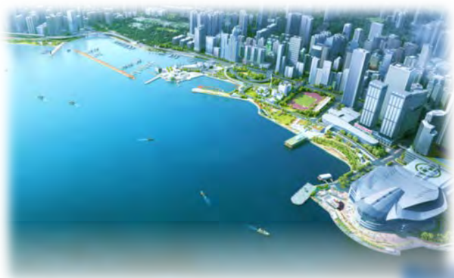
灣仔北至北角海傍