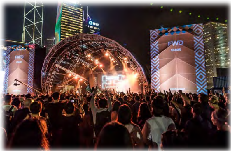
中環海濱活動空間