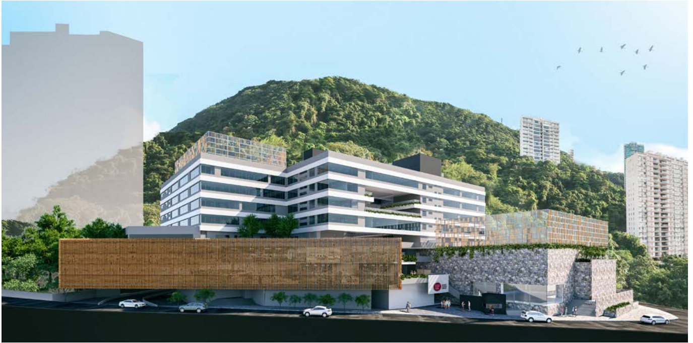
VIEW OF THE SCHOOL PREMISES FROM NORTHEAST (THE LOWER END OF BORRETT ROAD) (ARTIST'S IMPRESSION)