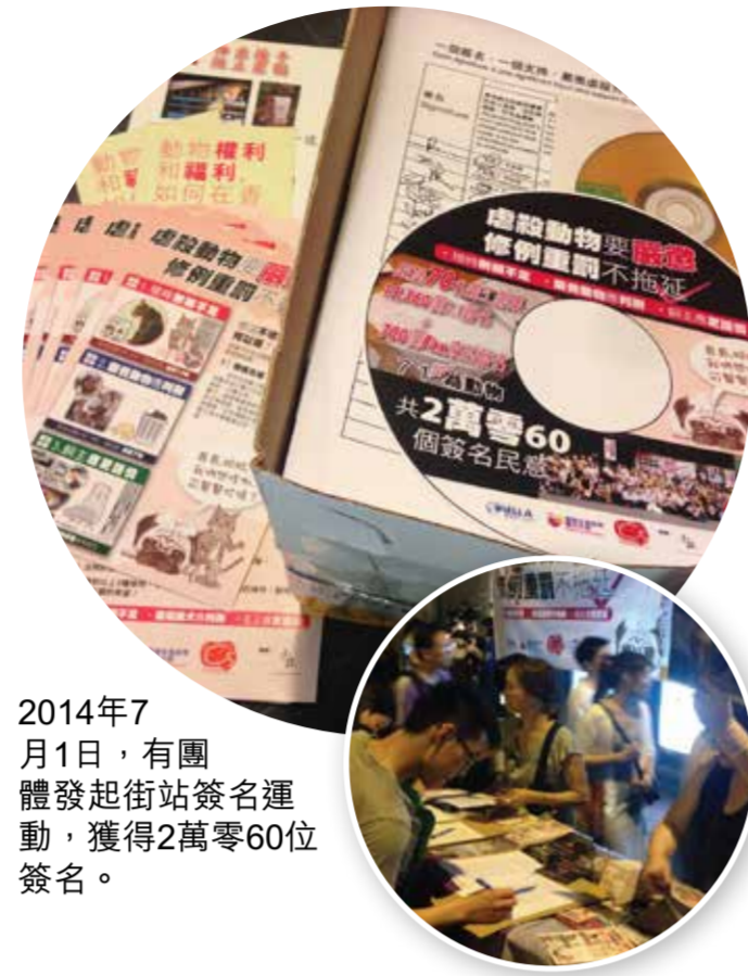
2014年7月1日，有團體發起街站簽名運動，獲得2萬零60位簽名。