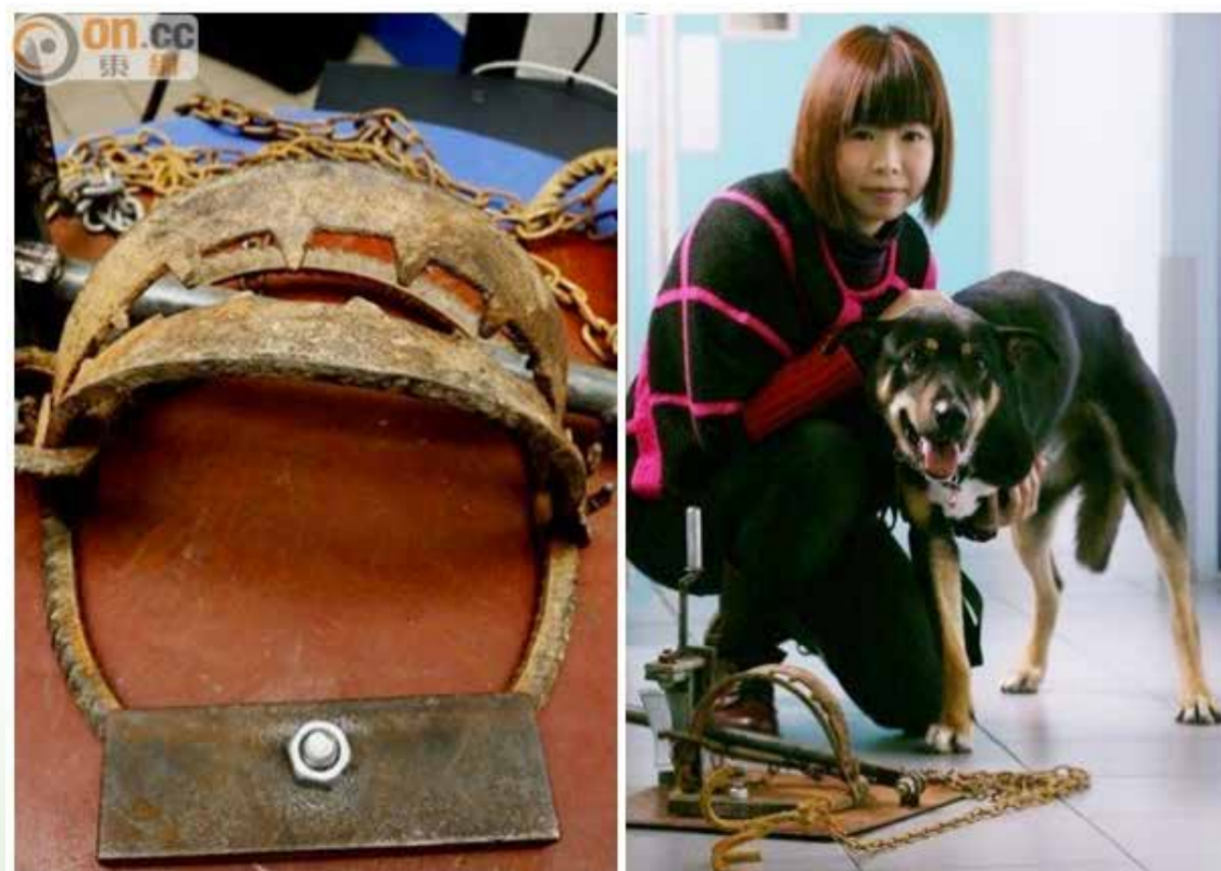
(左圖)香港愛護動物協會檢獲非法捕獸器。(右圖)部分受害動物需截肢。

http://hk.on.cc/hk/bkn/cnt/news/20150302/bkn-20150302163005315-0302_00822_001.html