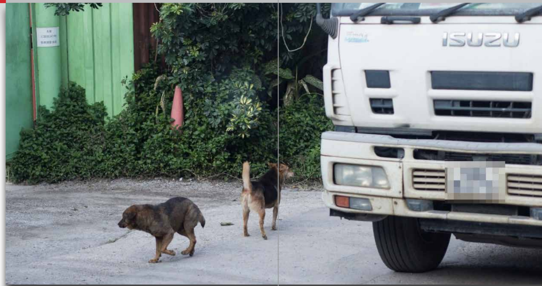
台灣、新加坡、英國和紐約都有條例保護狗隻在馬路的安全，唯獨香港仍停留在1972年的水平。

台灣以至歐美等地早有保護動物路權的條例。台灣在1998年已設立《動物保護法》，更在2015年提高了部分刑罰，亦收緊了規例。如證明司機行車途