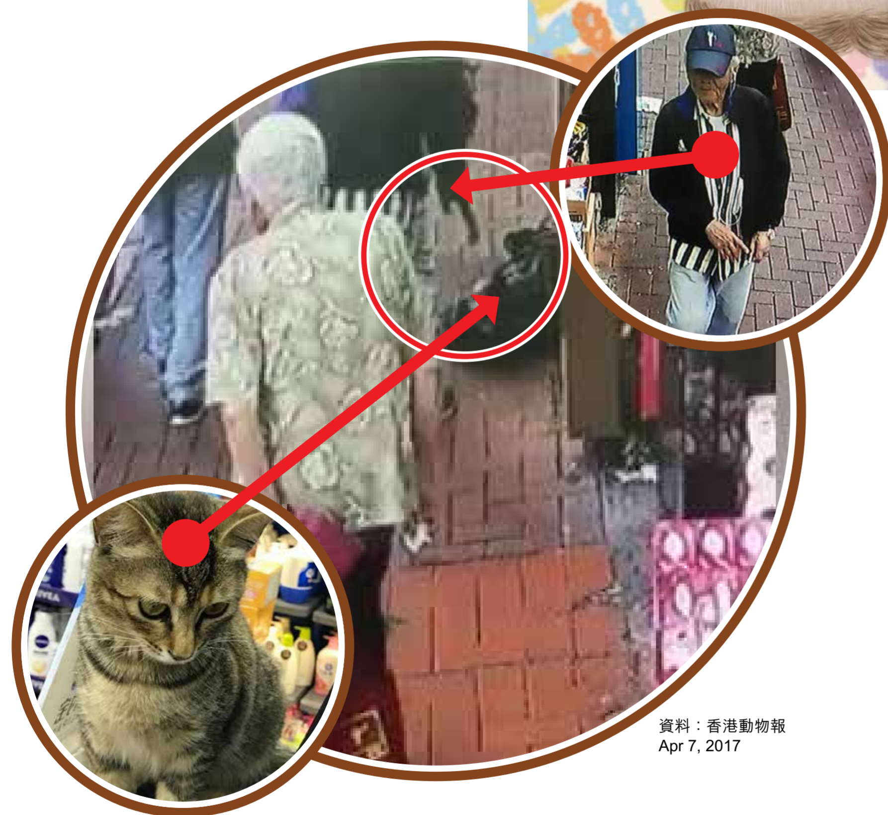
資料：香港動物報 Apr 7, 2017