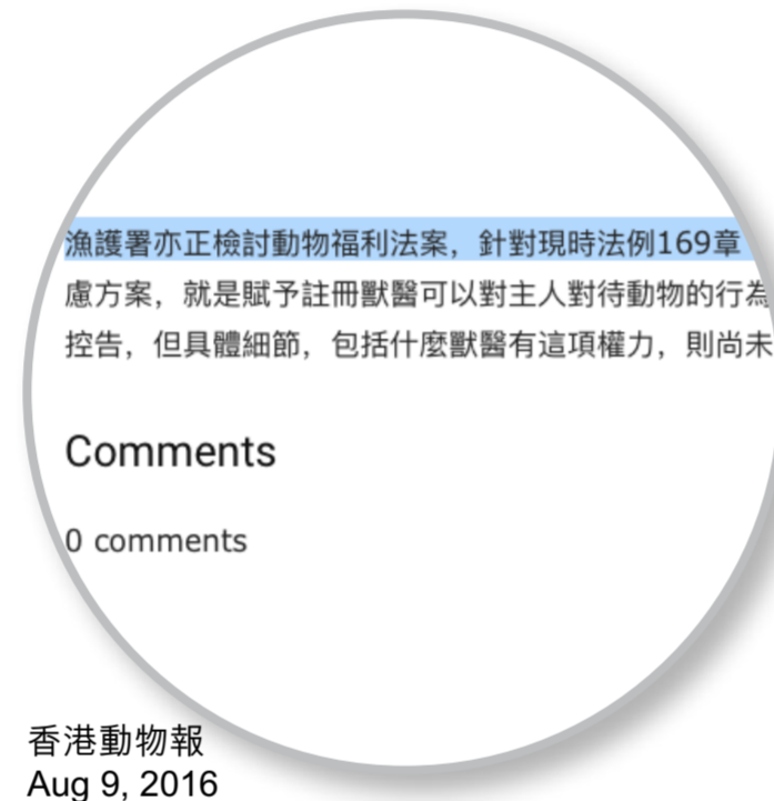
香港動物報 Aug 9, 2016