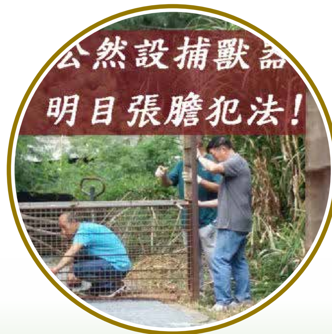
【香港動物報】粉嶺馬尾下村數人公然設置非法捕獸器 對義工惡言相向 http://www.hkanimalpost.com/2017/11/11/%E7%B2%89%E5%B6%BA%E9%A6%AC%E5%B0%BE%E4%B8%8B%E6%9D%91%E6%95%B8%E4%BA%BA%E5%85%AC%E7%84%B6%E8%A8%AD%E7%BD%AE%E9%9D%9E%E6%B3%95%E6%8D%95%E7%8D%B8%E5%99%A8%E3%80%80%E5%B0%8D%E7%BE%A9%E5%B7%A5%E6%83%A1/