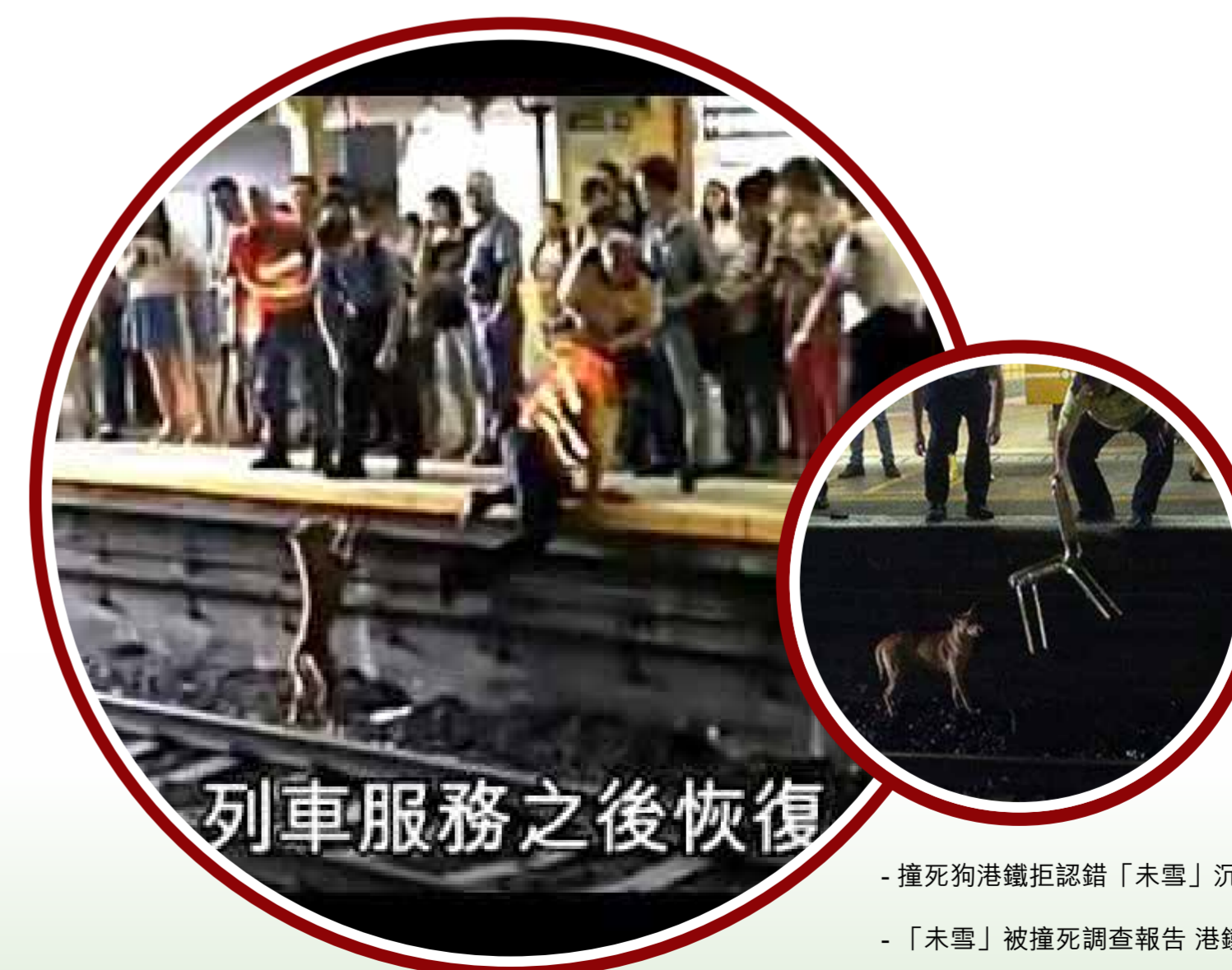
- 撞死狗港鐵拒認錯「未雪」沉冤未雪 (YouTube)

元（約1168港元）；若果撞到如導盲犬的服務犬不顧而去，則罰款不超過150美元（約1168港元），再犯需罰款不超過300美元（約2337港元）。