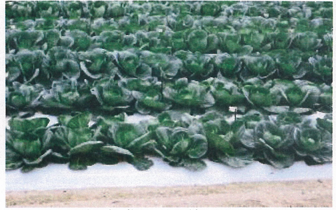
露天椰菜品種示範