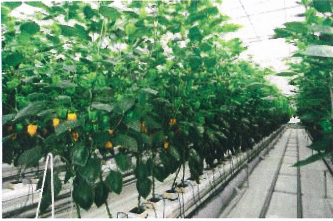
自動化溫室水耕生產