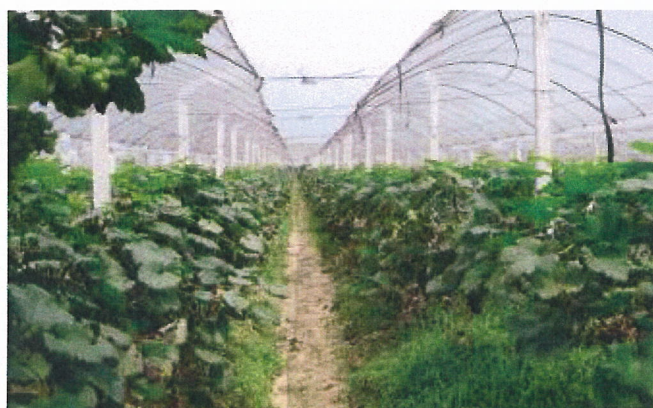
簡易大棚葡萄生產