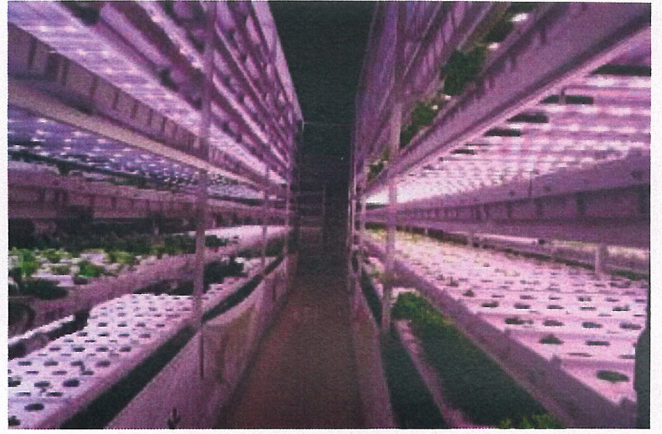
全環控 LED 光照溫室