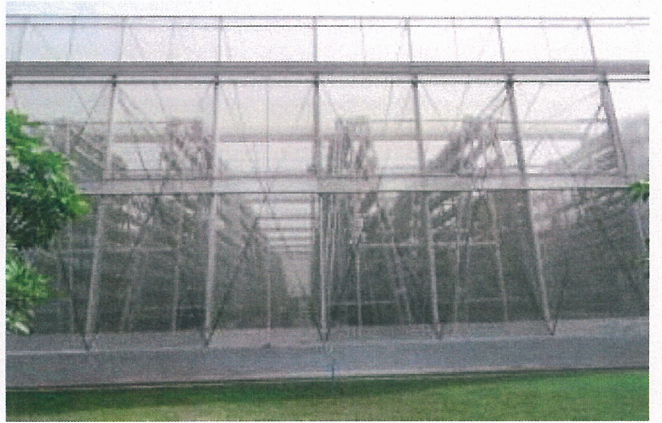
溫室高度約 10 米