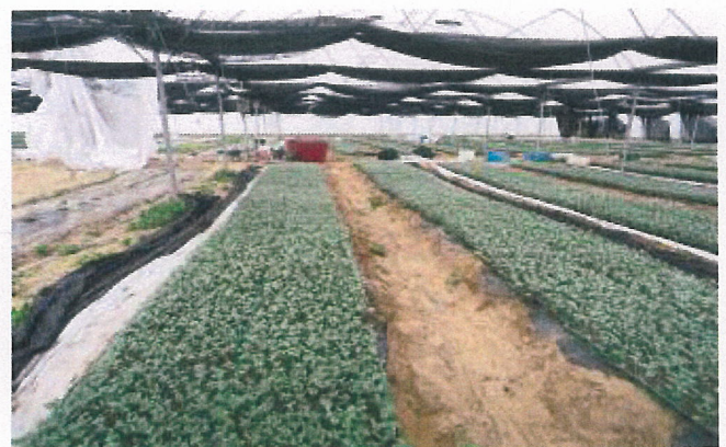
簡易大棚幼苗生產