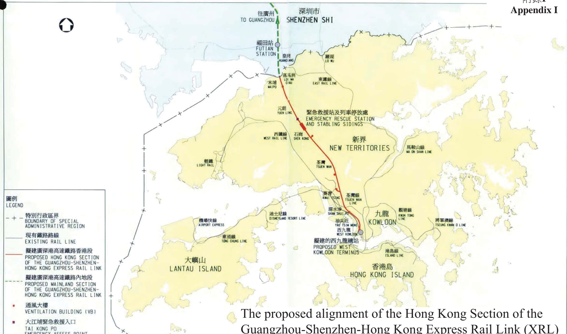
資料來源：於2014年5月發出的立法會CB(1)1328/13-14(03)號文件 Source: LC Paper No. CB(1)1328/13-14(03) issued in May 2014