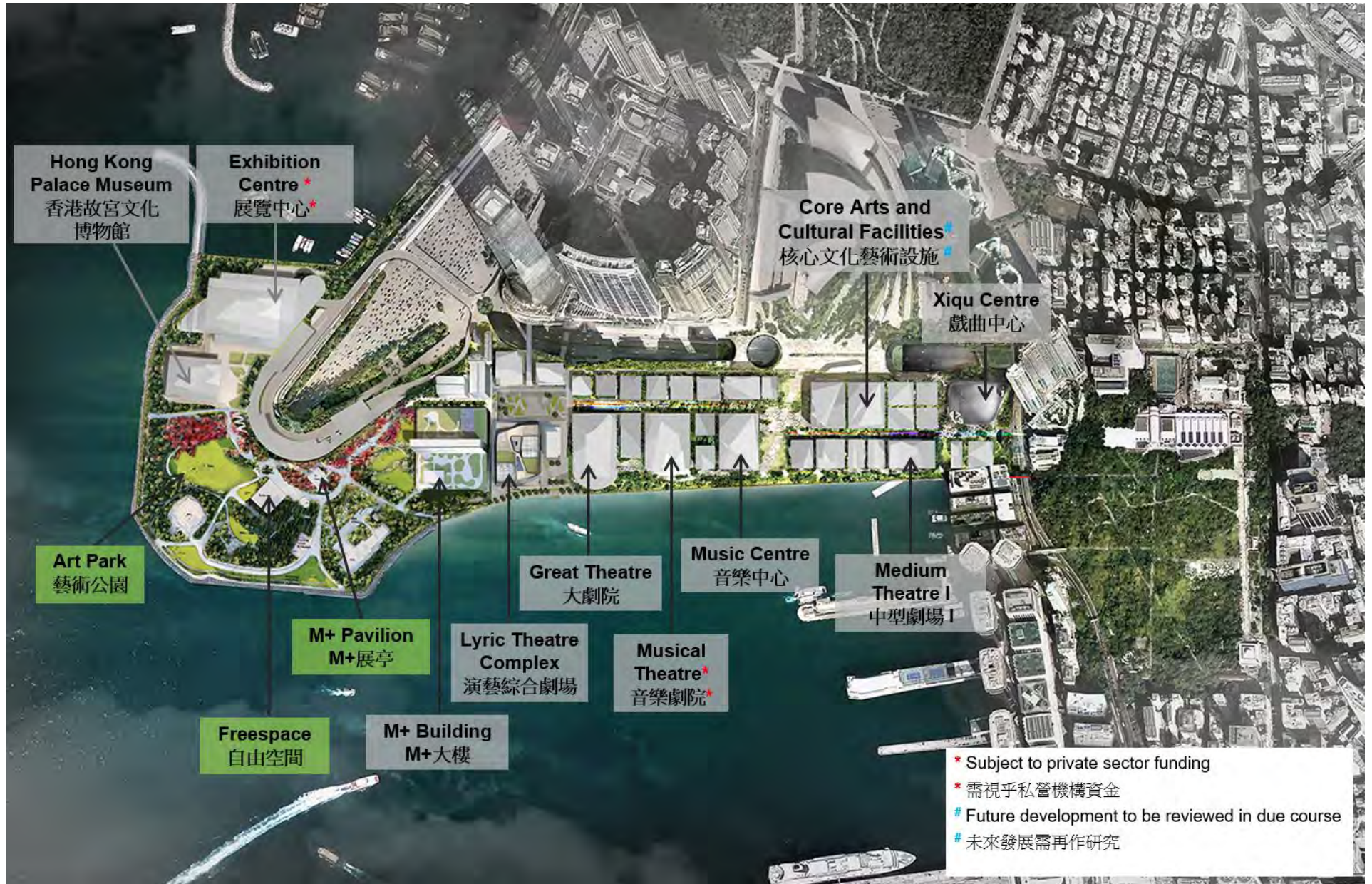
Annex 3: Location of the Art Park, M+ Pavilion and Freespace