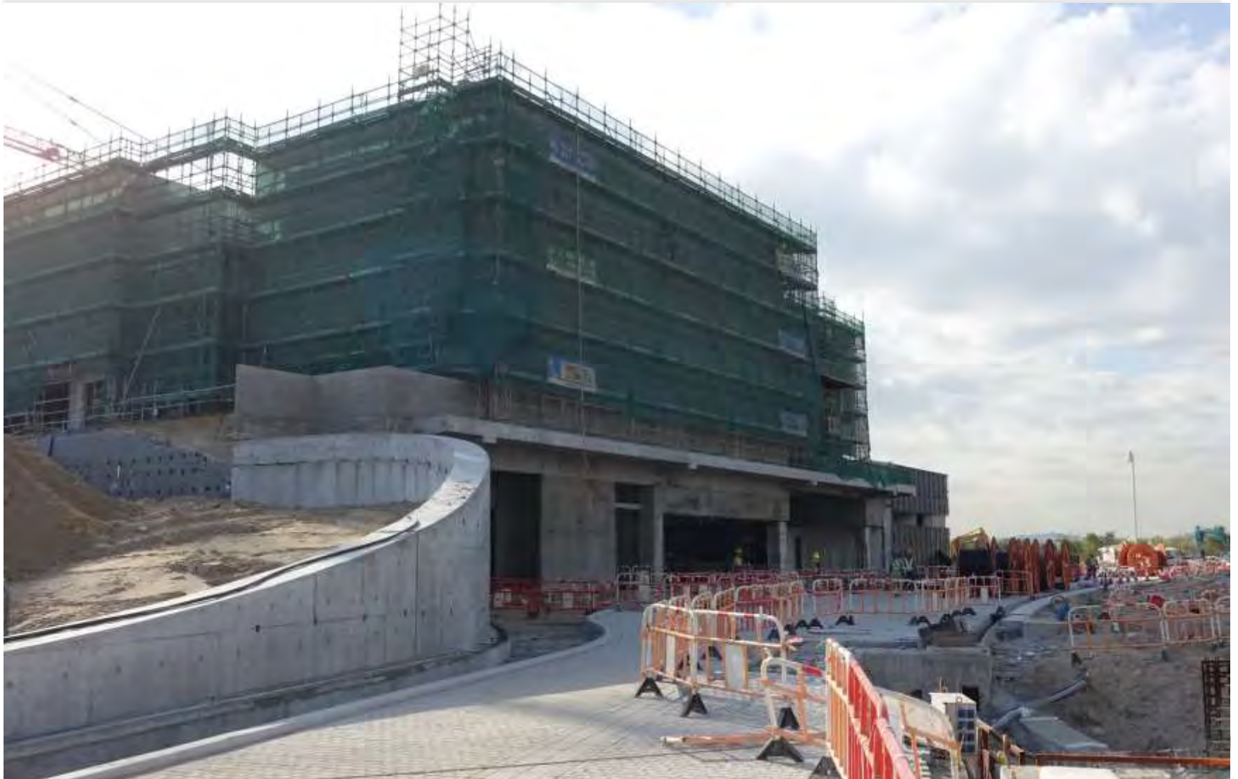
North Elevation of Freespace 自由空間北立面