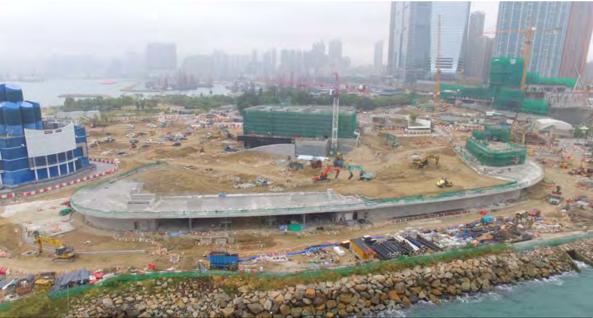
General view for RDE and Freespace 零售／餐飲／消閒設施及自由空間的工程概覽