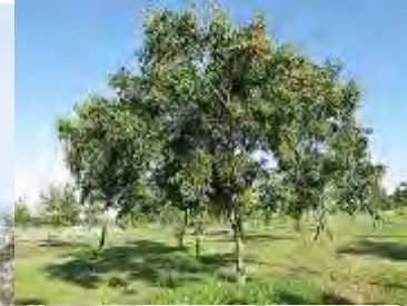
Sapindus spp. 無患子