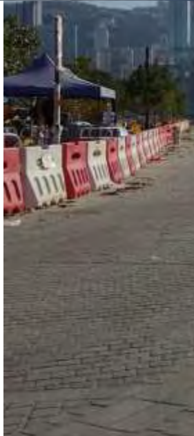
Art Park Promenade at Section 1 藝術公園海濱長廊第一階段工程