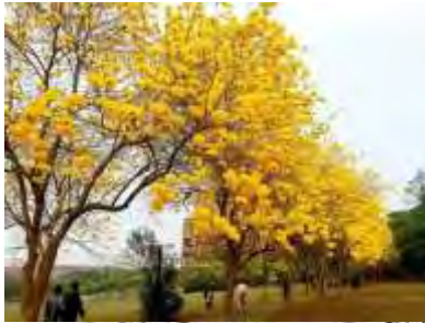
Tabebuia spp. 黃花風鈴木