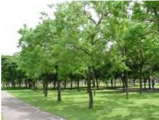
Sapium spp. 烏柏