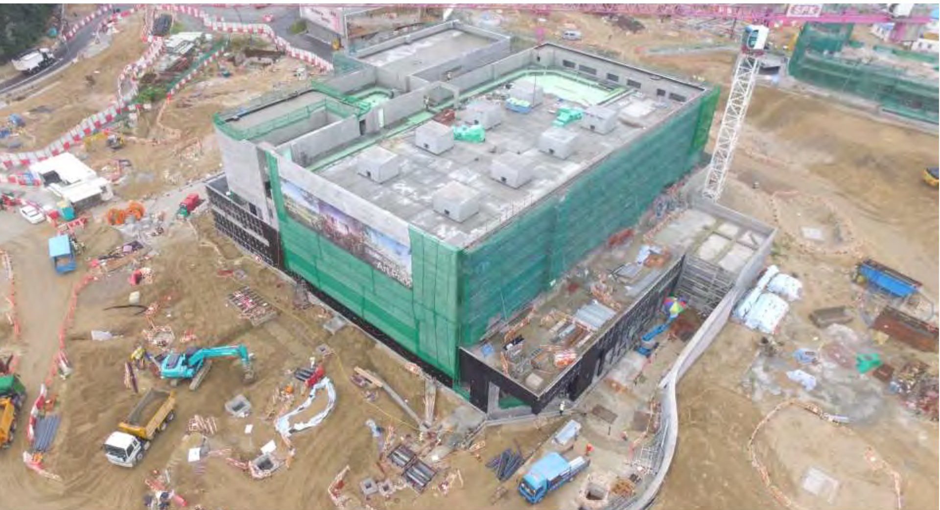
General view for Freespace 自由空間概覽