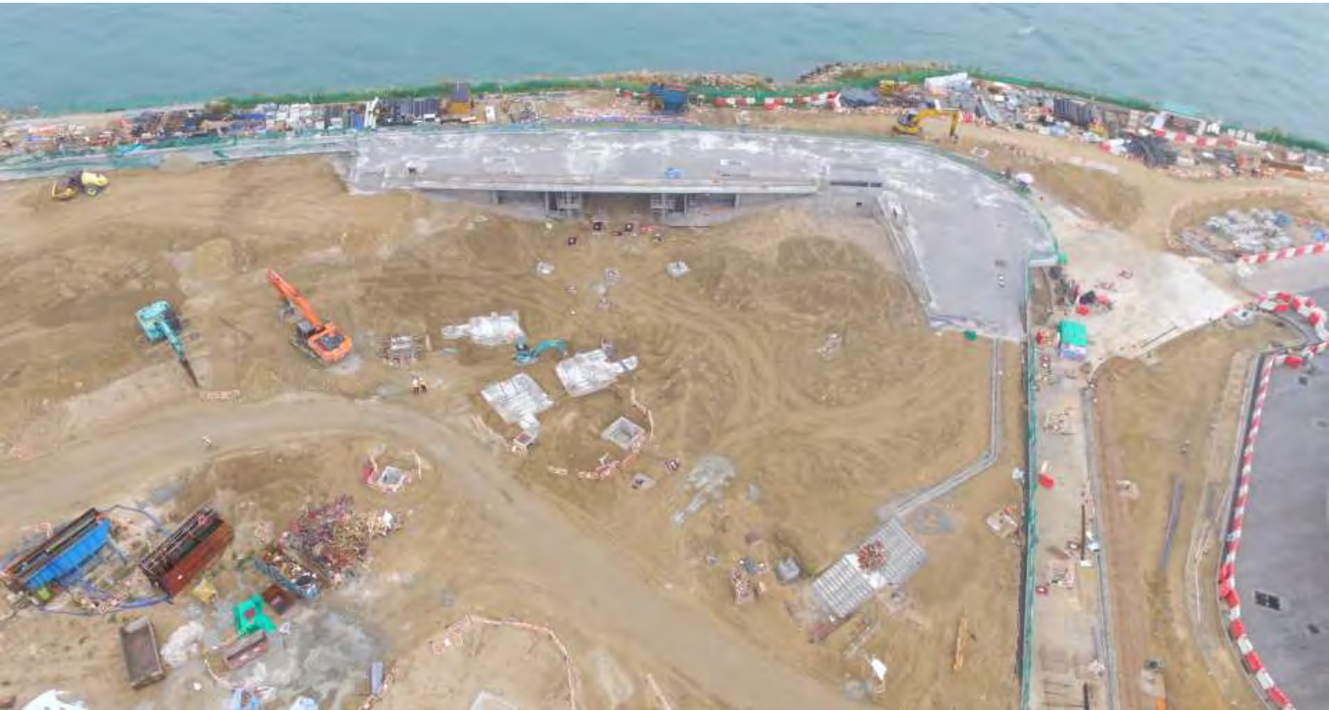
General view for RDE 零售／餐飲／消閒設施的工程概覽