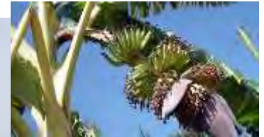
Musa spp. 小果野蕉