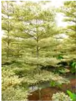
Terminalia spp. 花葉欖仁