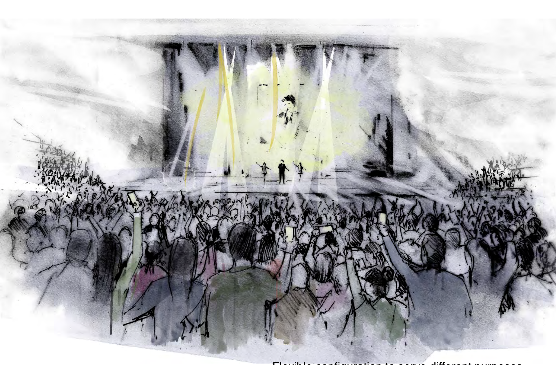
Flexible configuration to serve different purposes 場地容許靈活配置以滿足不同的需求