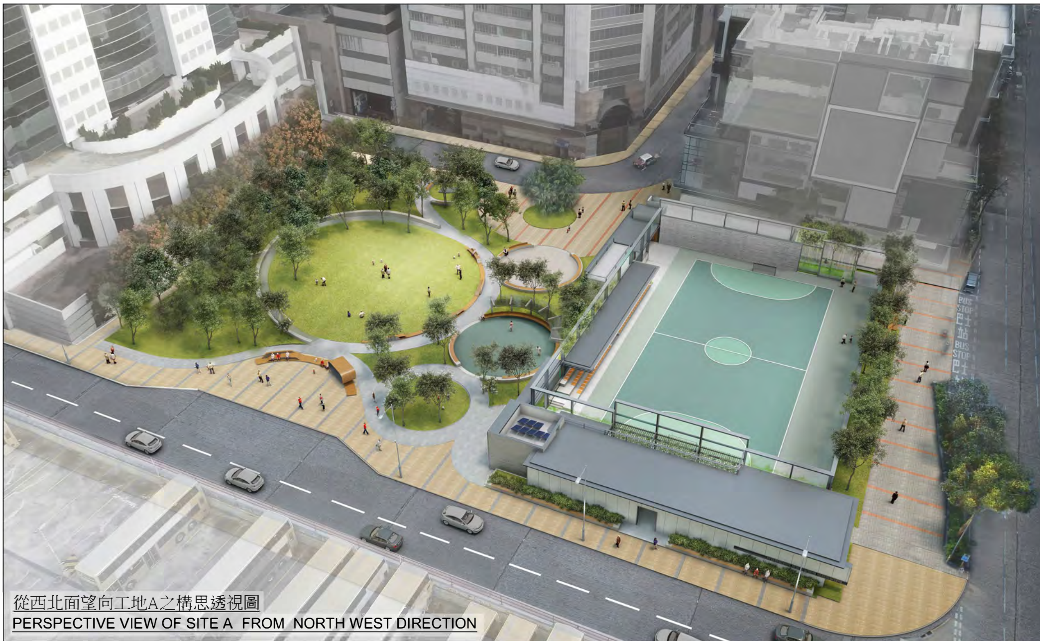
從西北面望向工地A之構思透視圖 PERSPECTIVE VIEW OF SITE A FROM NORTH WEST DIRECTION