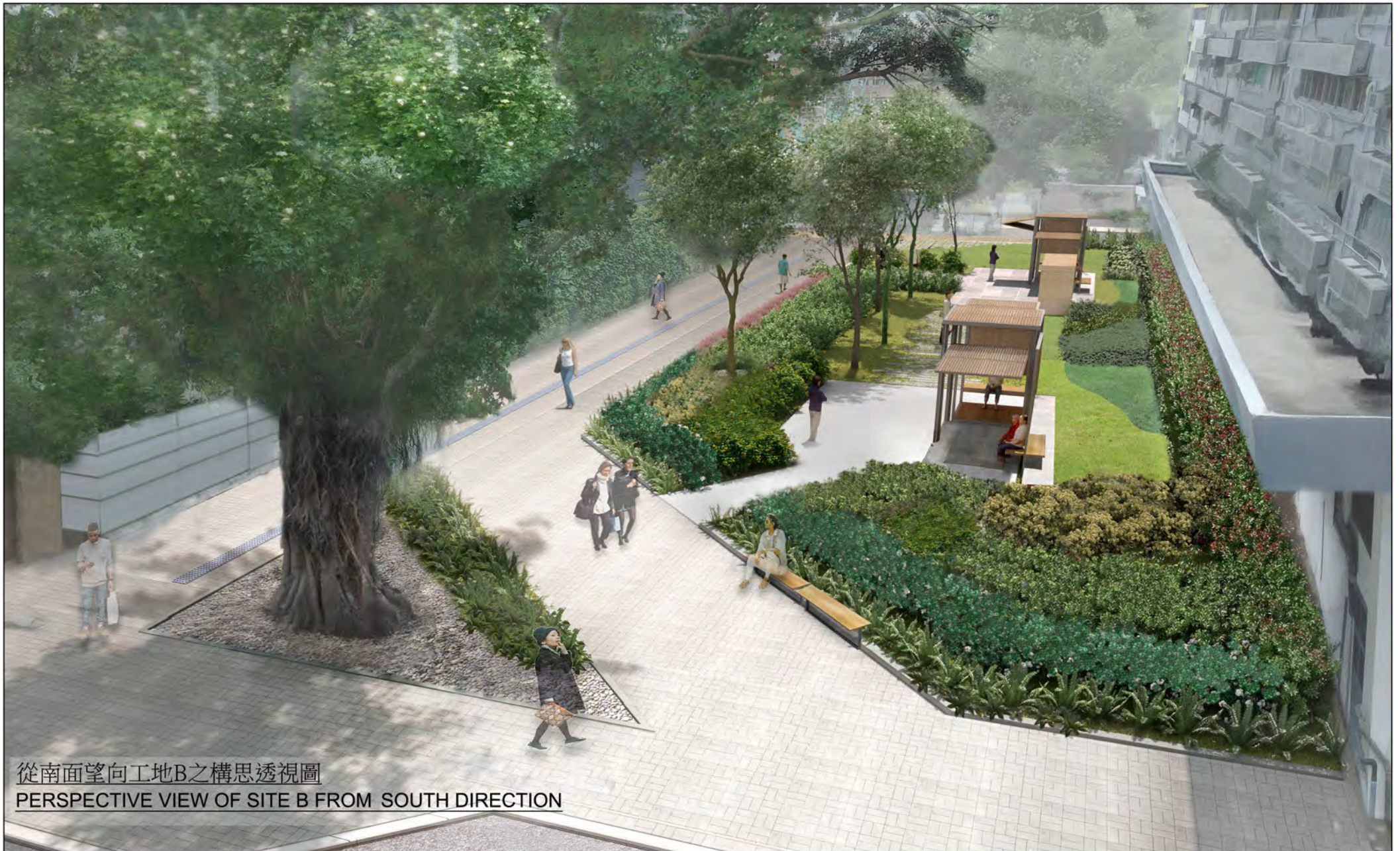
從南面望向工地B之構思透視圖 PERSPECTIVE VIEW OF SITE B FROM SOUTH DIRECTION