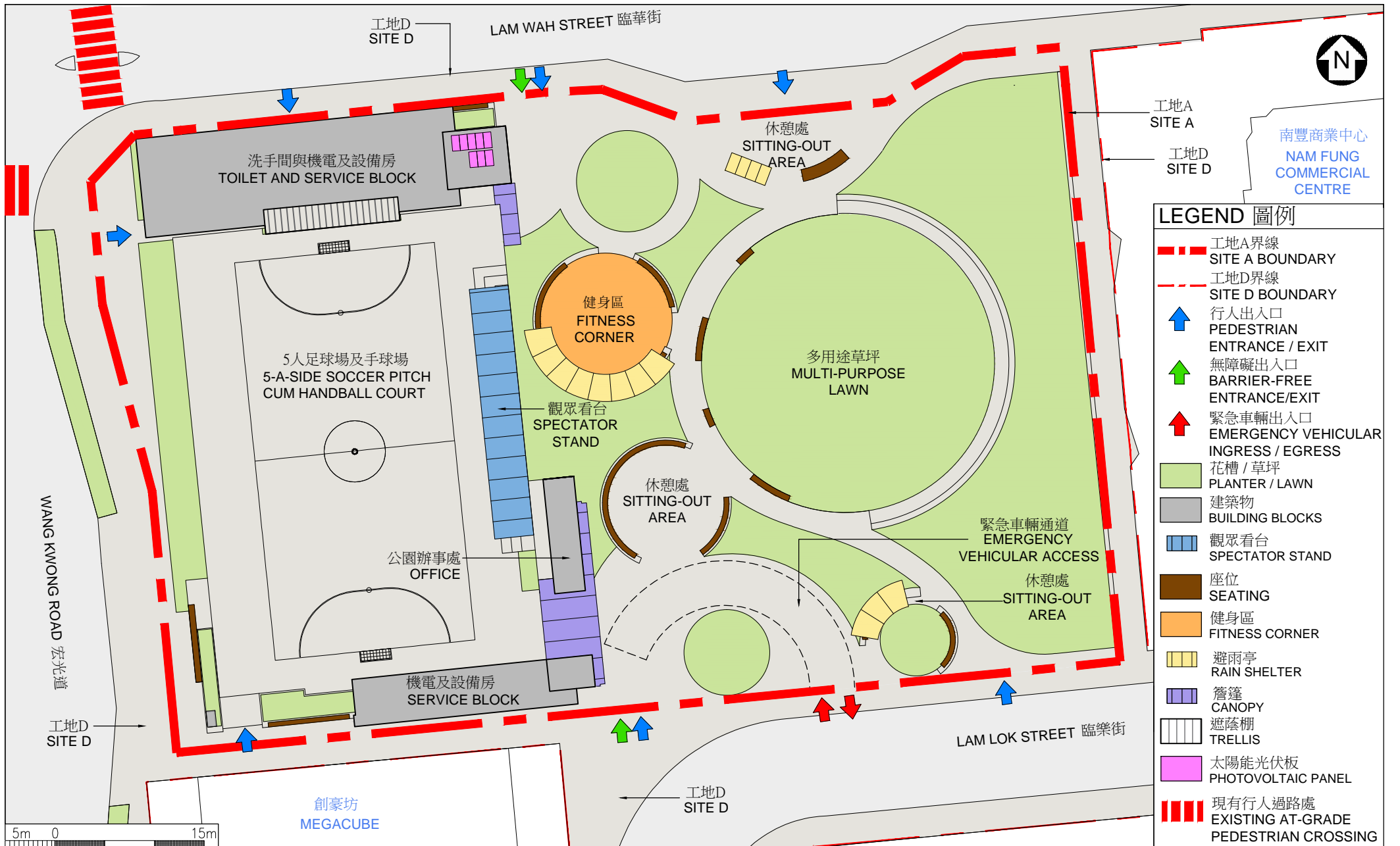
工地平面圖 (工地A) SITE PLAN (SITE A)

3468RO 臨華街遊樂場及其鄰近範圍改善工程 IMPROVEMENT OF LAM WAH STREET PLAYGROUND AND ADJACENT AREA