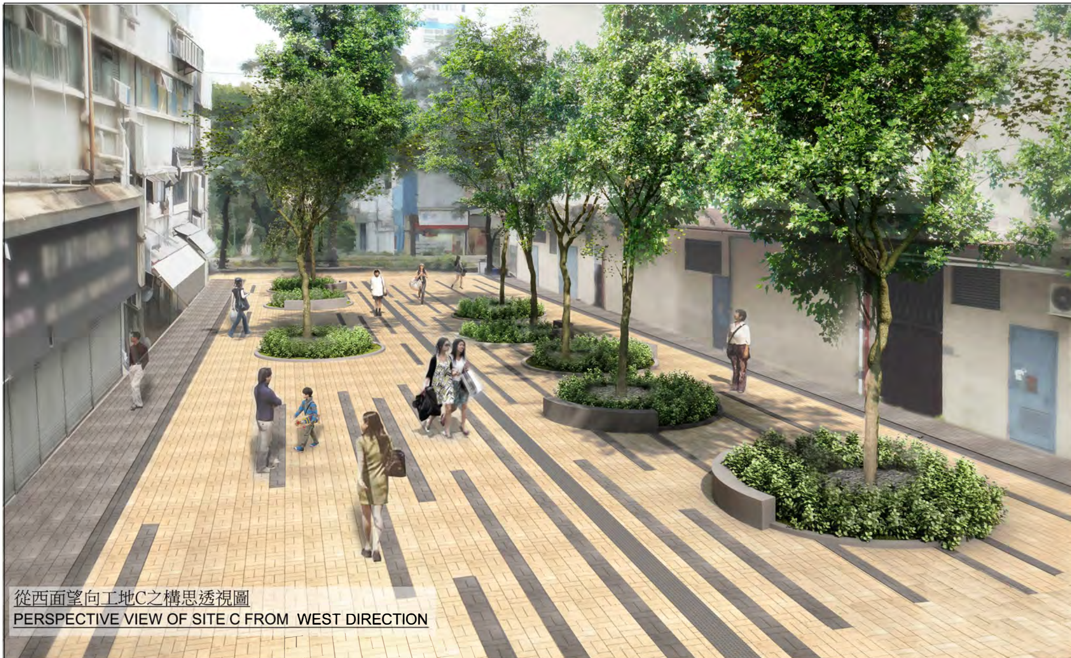
從西面望向工地C之構思透視圖 PERSPECTIVE VIEW OF SITE C FROM WEST DIRECTION