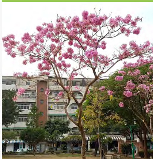
Tabebuia pentaphylla 紅花風鈴木 (E)