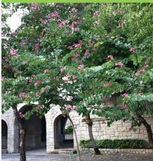
Bauhinia x blakeana 洋紫荊 (N)