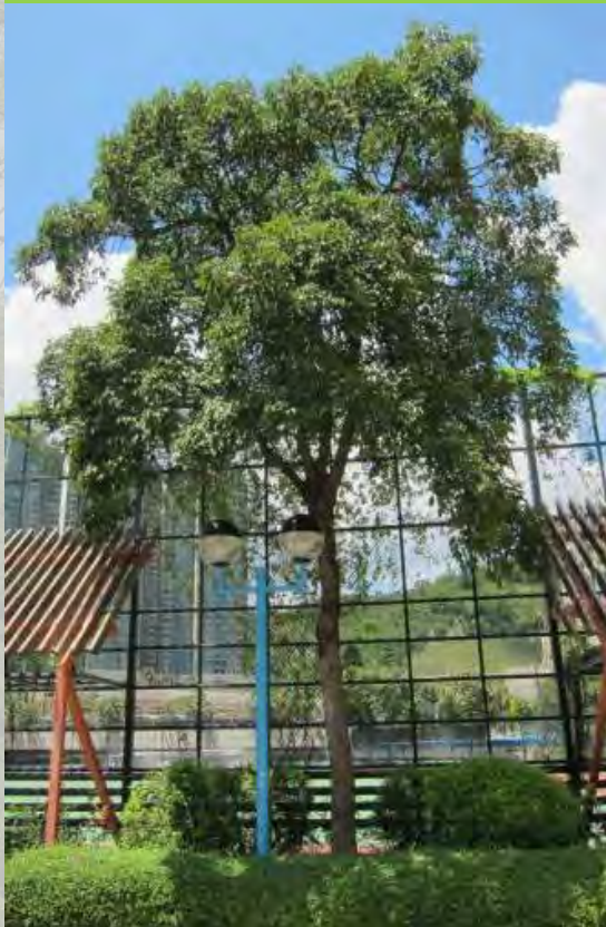
Bischofia javanica 秋楓 (N)