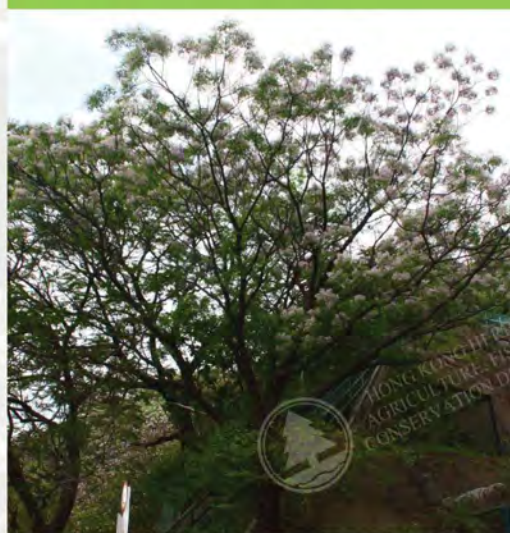
Melia azedarach 楝 (E)