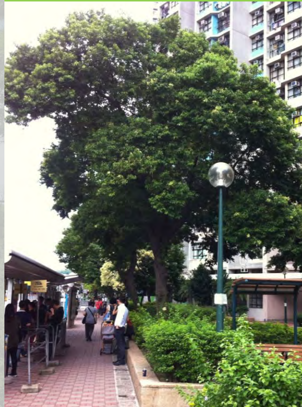
Cinnamomum burmanii 陰香 (N)