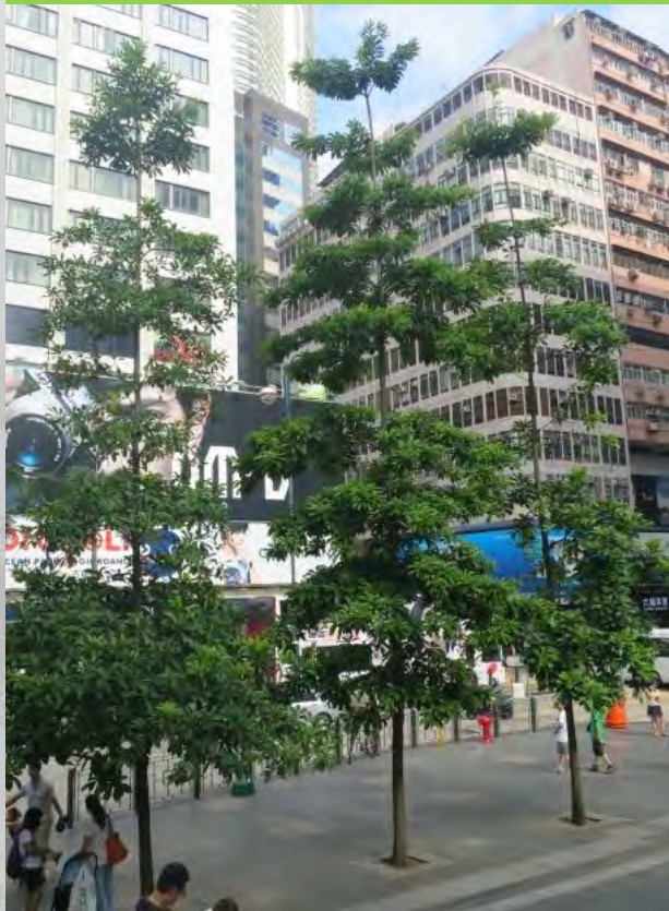
Elaeocarpus balansae 大葉杜英 (E)