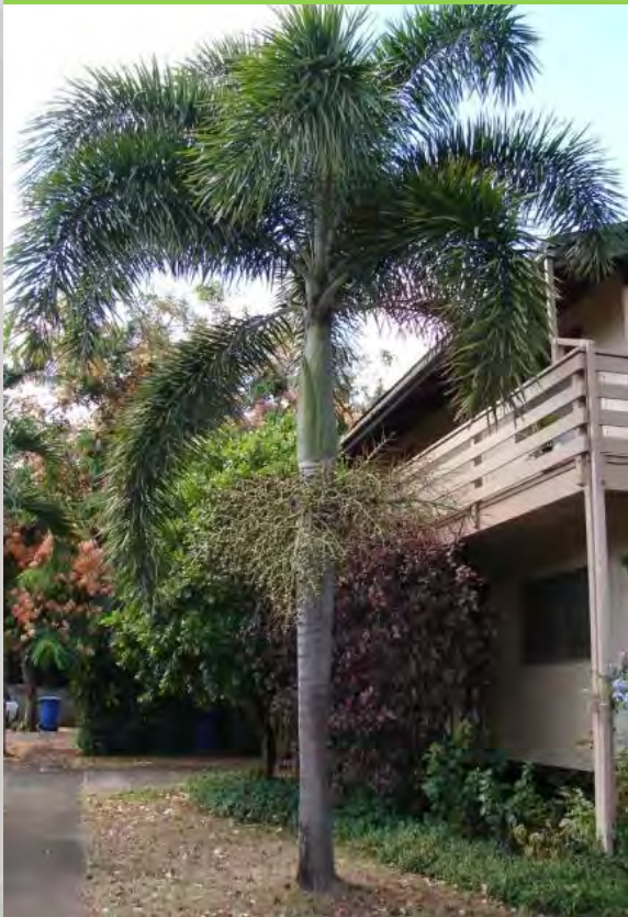
Wodyetia bifurcata 狐尾椰子 (E)