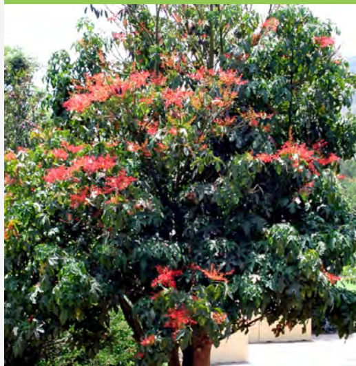
Brachychiton acerifolius 槭葉蘋婆 (E)