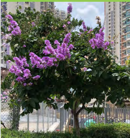
Lagerstroemia speciosa 大花紫薇 (E)