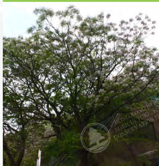
Melia azedarach 楝 (E)