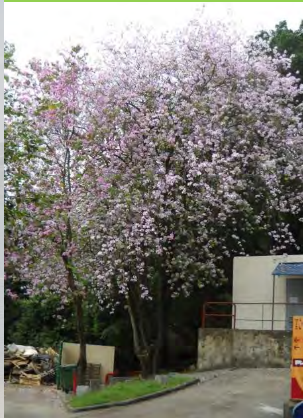
Bauhinia variegata 宮粉羊蹄甲 (E)