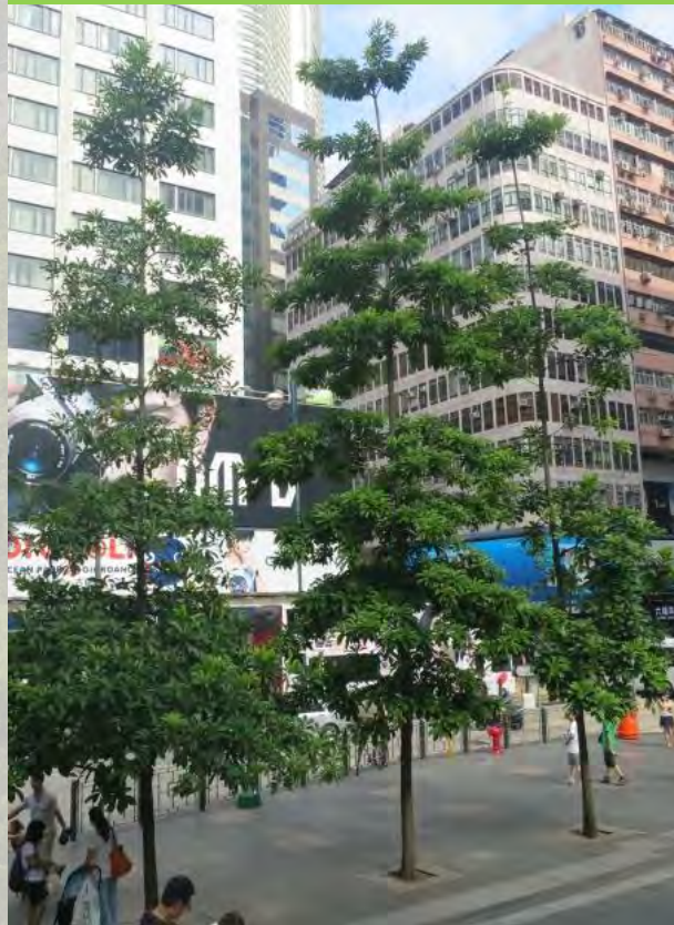
Elaeocarpus balansae 大葉杜英 (E)