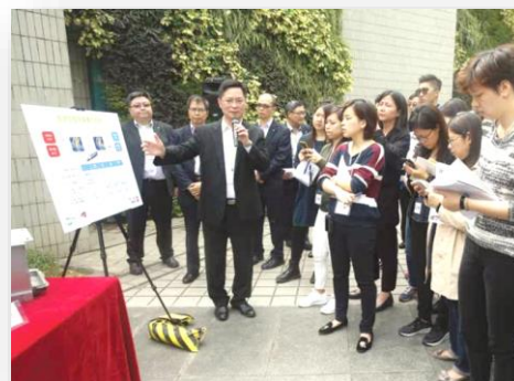
機電署開放大樓助初創企業試驗及核證