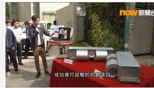
成功進行試驗的初創項目