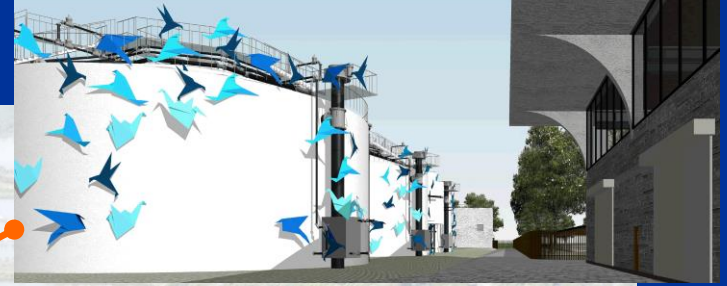
污泥消化缸美化概念圖