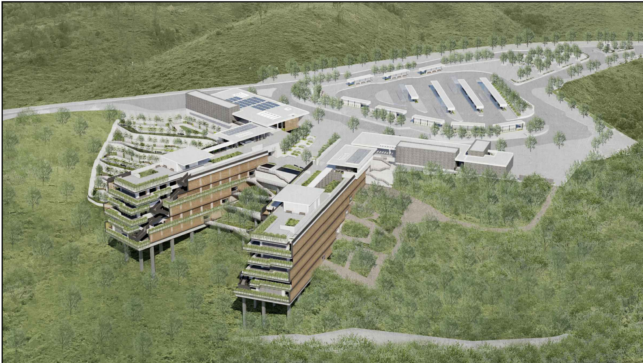
從西南面望向骨灰安置所的構思透視圖 PERSPECTIVE VIEW OF COLUMBARIUM FROM SOUTHWEST DIRECTION