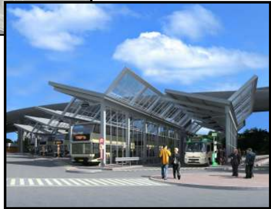
擬議公共運輸交匯處