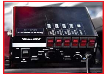
車內警號系統控制器