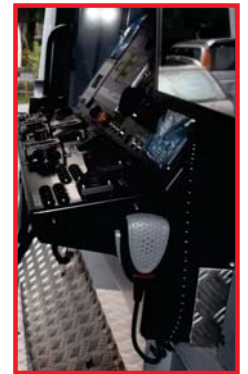
車內廣播系統收音器