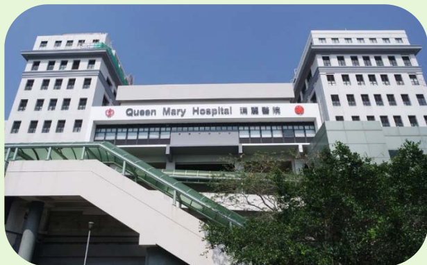
醫管局轄下的19間醫院