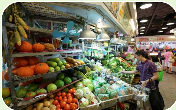
食環署的40個 街市及熟食場地