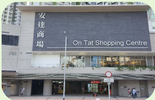
9個公共屋邨商場和 濕貨街市