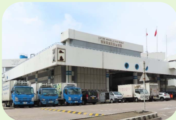
漁護署的兩個 副食品批發市場