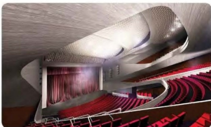
1450-seat Lyric Theatre (LT) 1450 個座位的演藝劇場