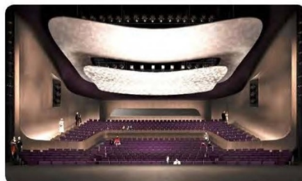
600-seat Medium Theatre (MT) 600 個座位的中型劇場