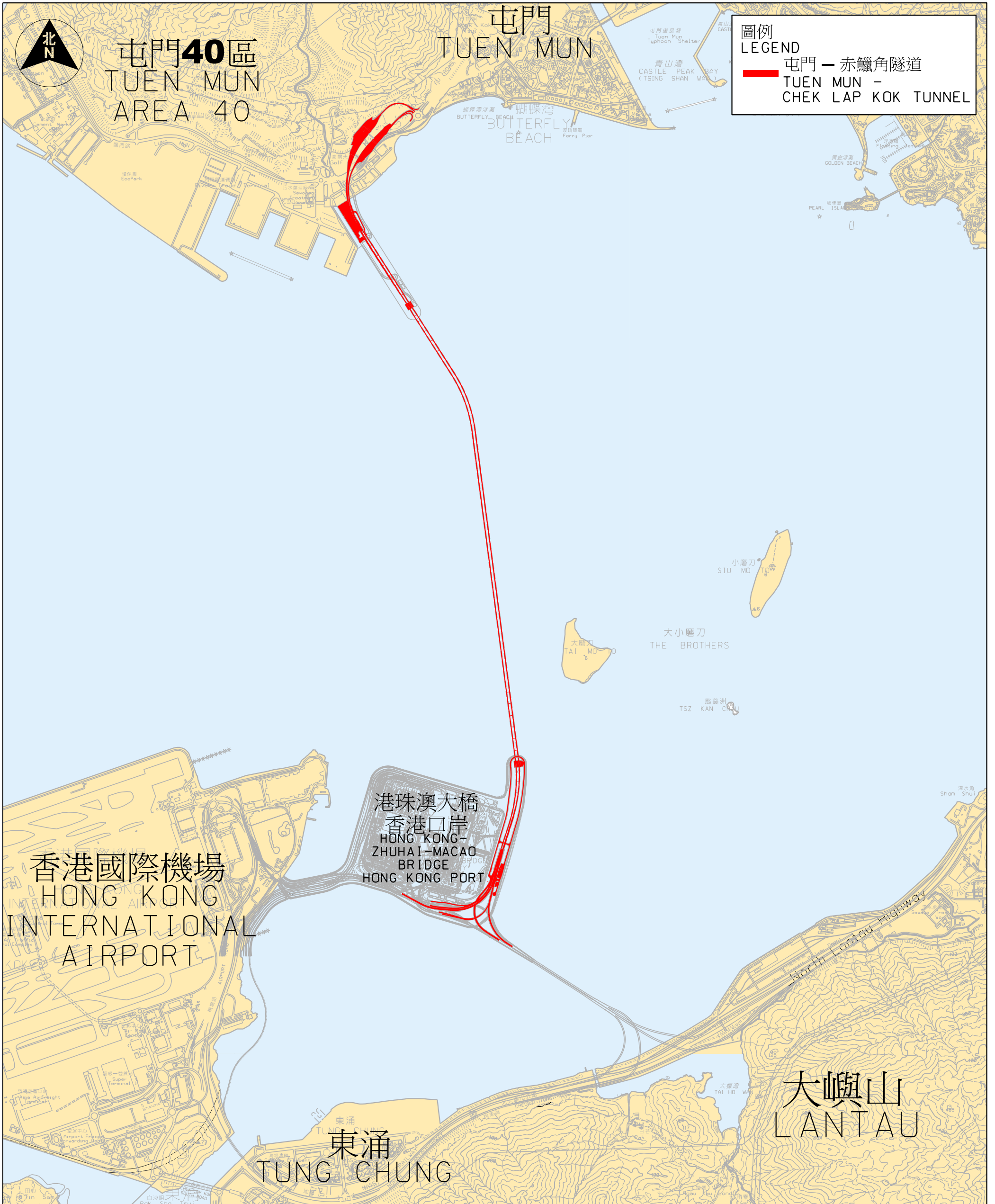
屯門 — 赤鱗角隧道位置圖