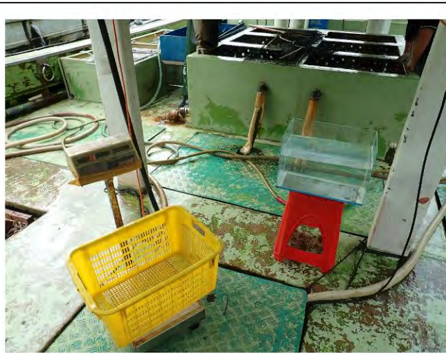
Taking measurements of 40 heads of Cheilinus undulates :