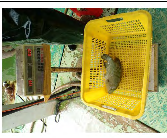
1. The length was 39 cm, 1.35 kg