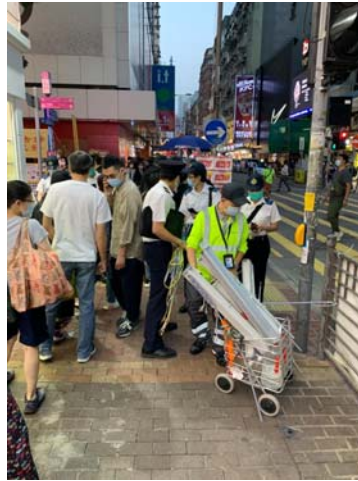
清理街上非法展示商業宣傳品