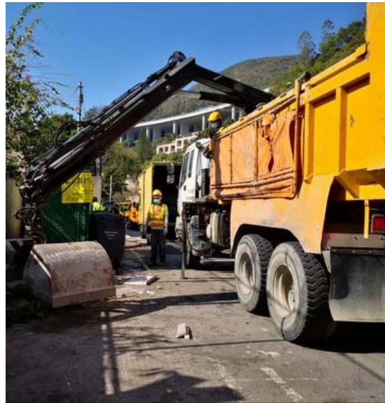
清理荃灣青山公路－汀九段