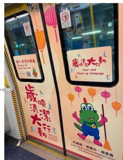
透過不同渠道（例如電視宣傳片和電台宣傳聲帶）及清潔龍「阿德」Facebook和Instagram專頁宣傳個人、家庭及環境衛生信息