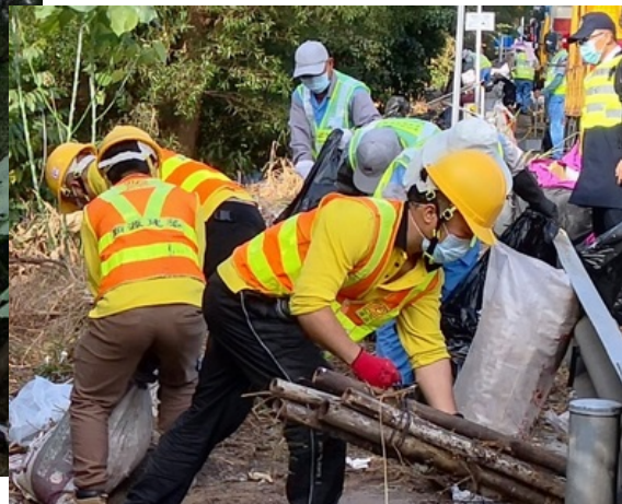
清理深水埗連翔道公用道路