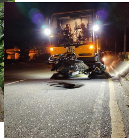
食環署加強公共道路清潔和清掃