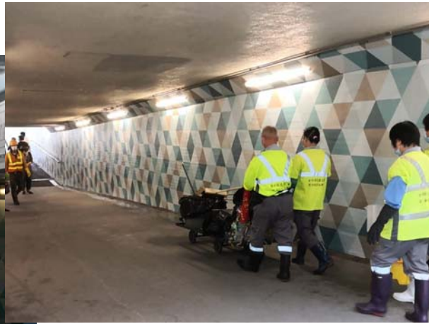
清理黃大仙樂善道與彩虹道交界行人隧道KS12