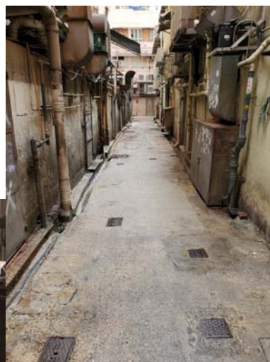
行動後清潔水平得以提升