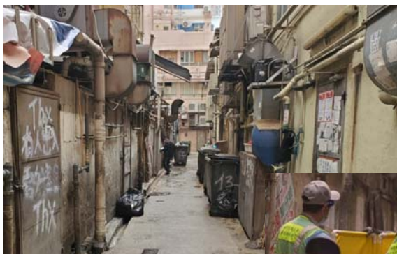
食肆林立的後巷垃圾堆積情況