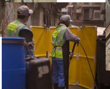
加強後巷清理工作