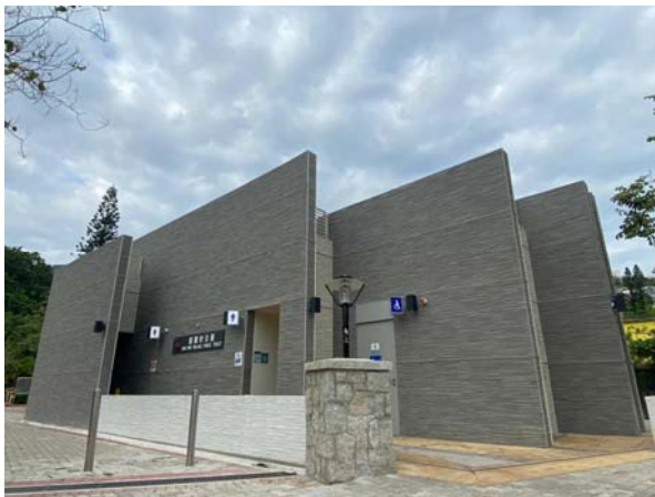
2020年第四季新建並開放予公眾的南區新圍村公廁