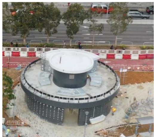
正在興建並即將落成的荃灣區海興路公廁