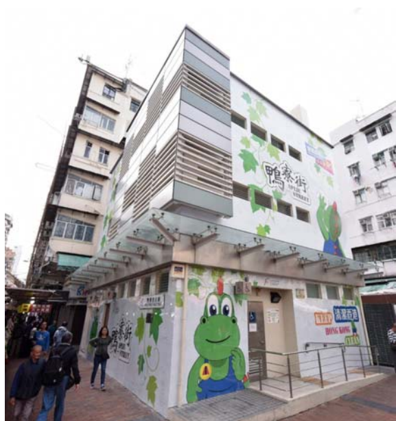
深水埗鴨寮街公廁