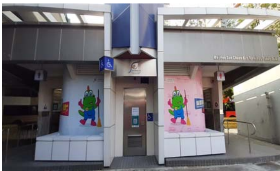
深水埗美孚新邨巴士總站公廁