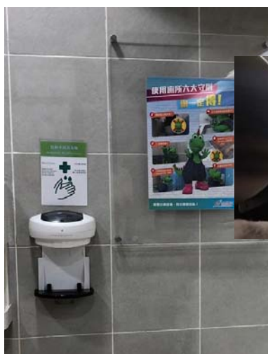
自動感應式手部消毒機