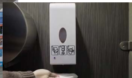
自動感應式廁盆座板消毒機