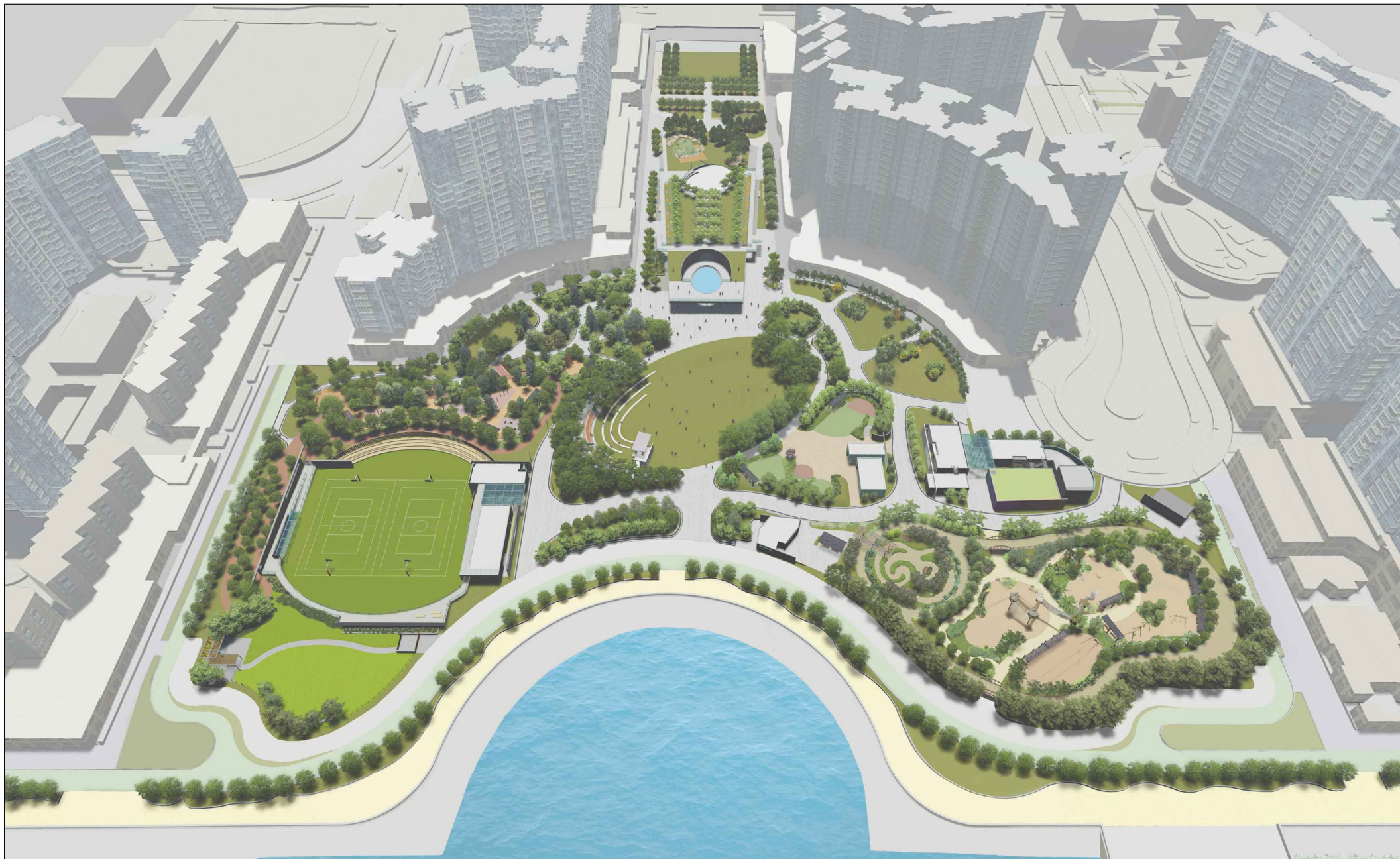
從南面望向市鎮公園的構思透視圖 PERSPECTIVE VIEW FROM SOUTHERN DIRECTION (ARTIST'S IMPRESSION)

451RO 將軍澳第68區市鎮公園 TOWN PARK IN AREA 68, TSEUNG KWAN O