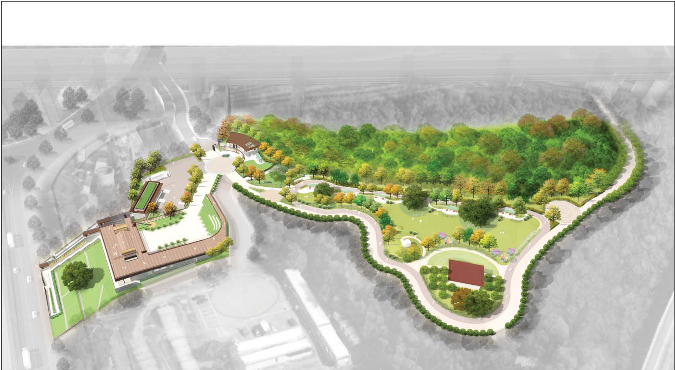
從南面望向葵涌公園的構思透視圖 PERSPECTIVE VIEW FROM SOUTHERN DIRECTION