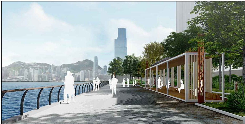
觀景點一的構思透視圖 PERSPECTIVE VIEW OF LOOKOUT POINT 1