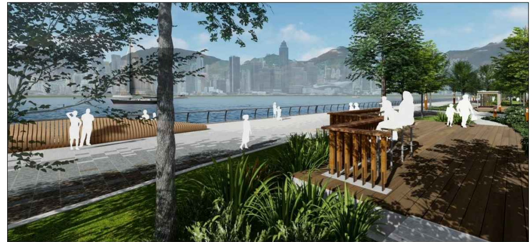
觀景點二的構思透視圖 PERSPECTIVE VIEW OF LOOKOUT POINT 2