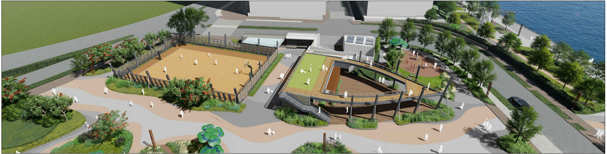
從西面望向擬議觀景台及籃球場的構思透視圖 PERSPECTIVE VIEW OF THE PROPOSED VIEWING DECK AND BASKETBALL COURT VIEWING FROM WEST DIRECTION (ARTIST'S IMPRESSION)