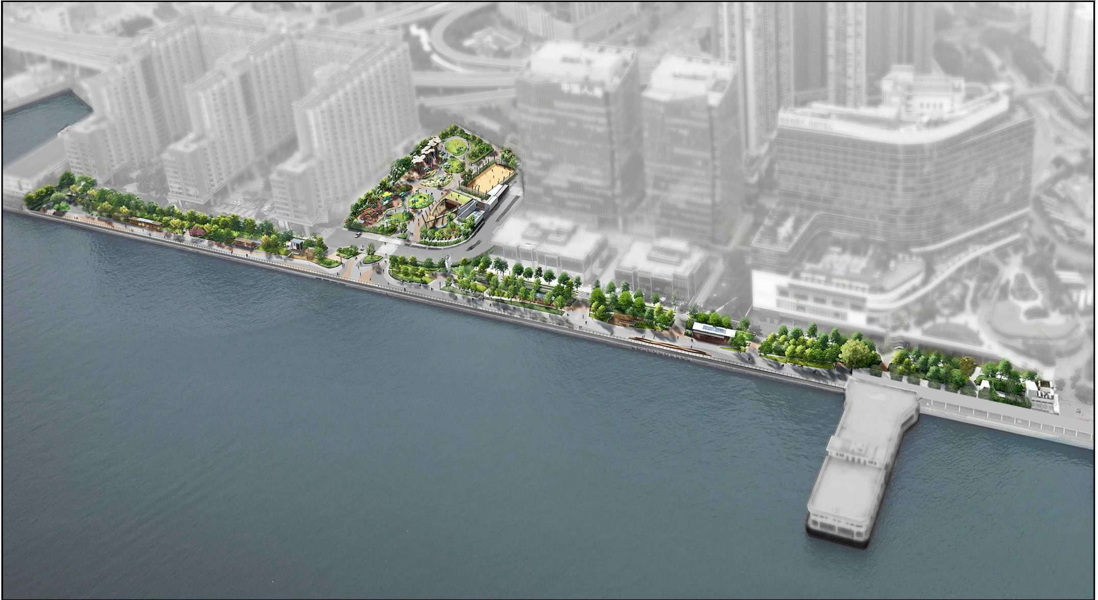
從東面望向休憩用地的構思透視圖 PERSPECTIVE VIEW FROM EASTERN DIRECTION (ARTIST'S IMPRESSION)