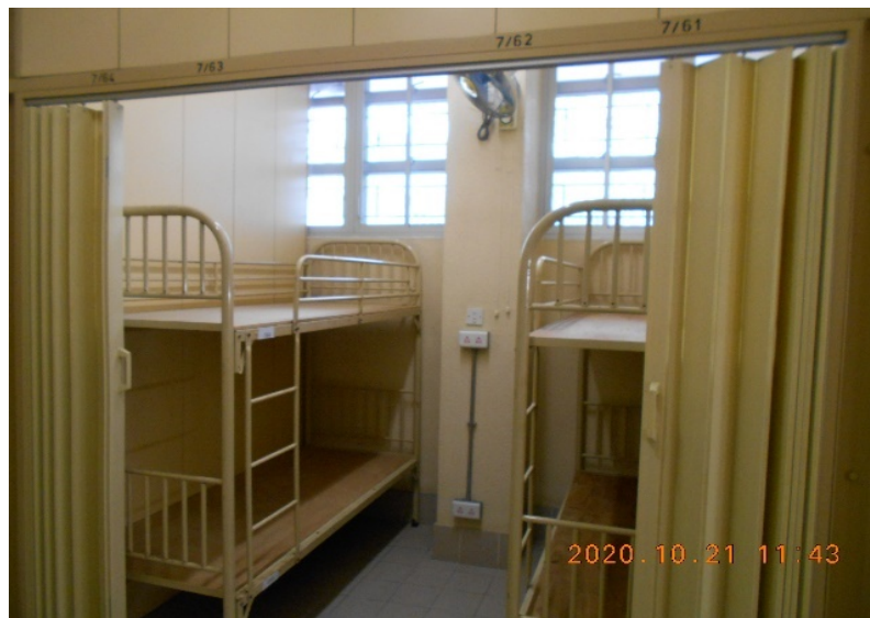
4人睡眠間 (收容女性及家庭)