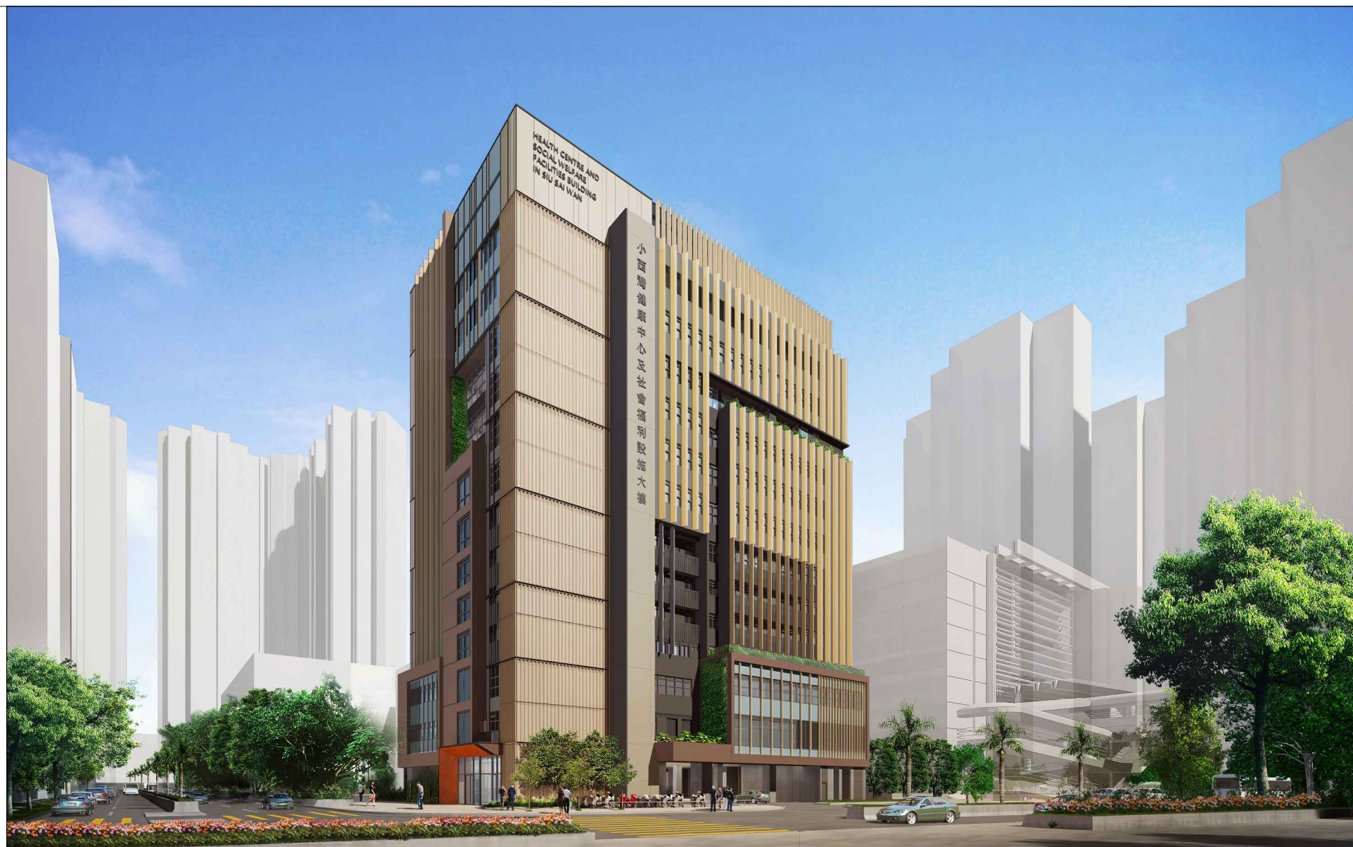
從西面望向大樓的構思透視圖 PERSPECTIVE VIEW FROM WEST DIRECTION (ARTIST'S IMPRESSION)