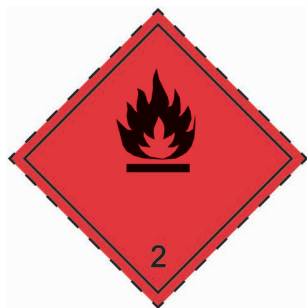
S2 第 2.1 類危險品的標籤