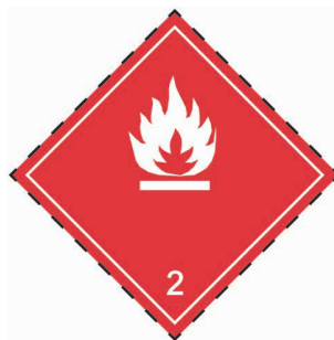
S2 第 2.1 類危險品的標籤