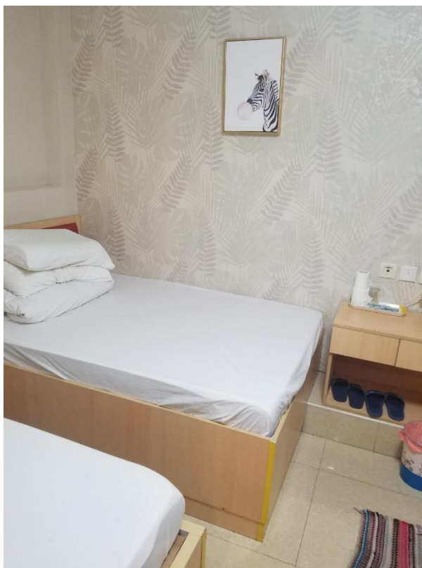
圖 12: 作為過渡性房屋的賓館房間(6)