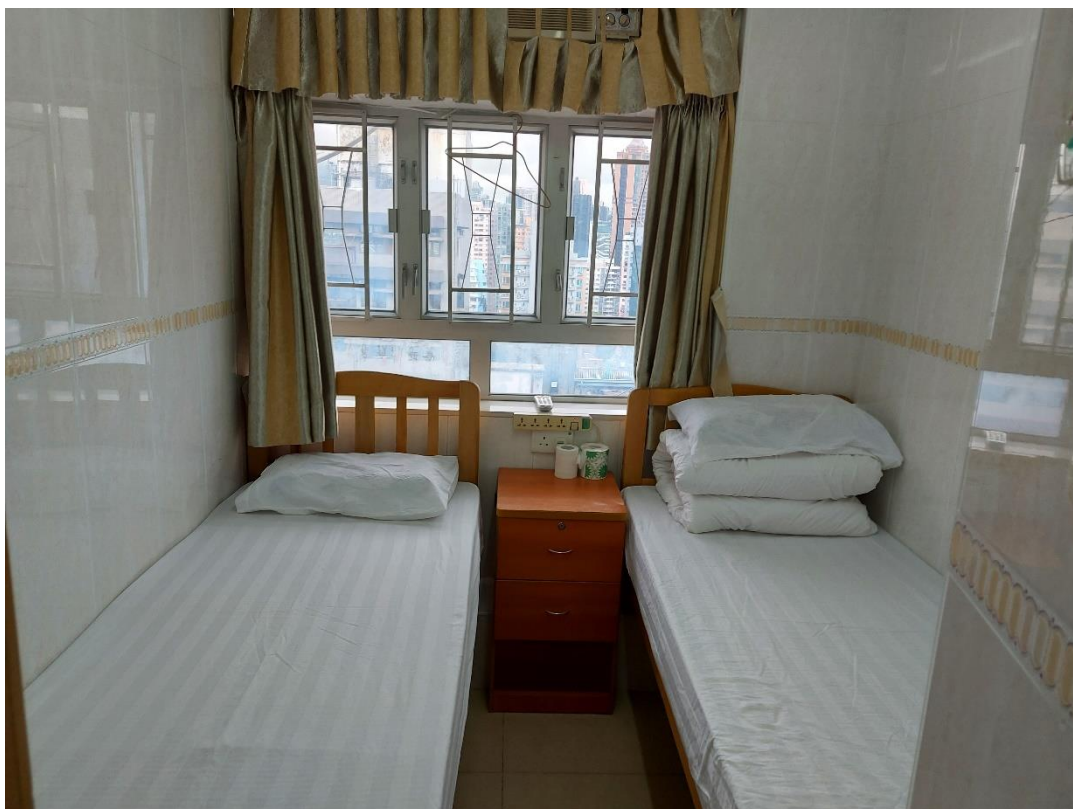
圖 10: 作為過渡性房屋的賓館房間(4)