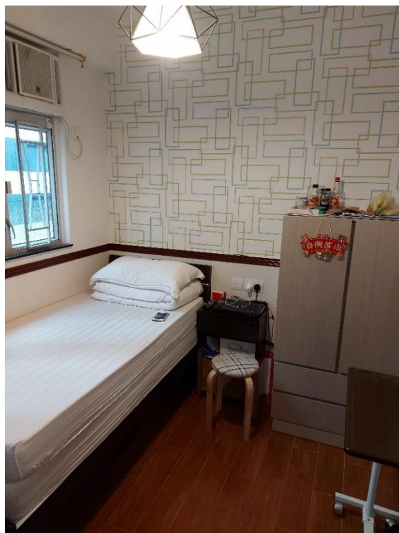
圖 8: 作為過渡性房屋的賓館房間(2)