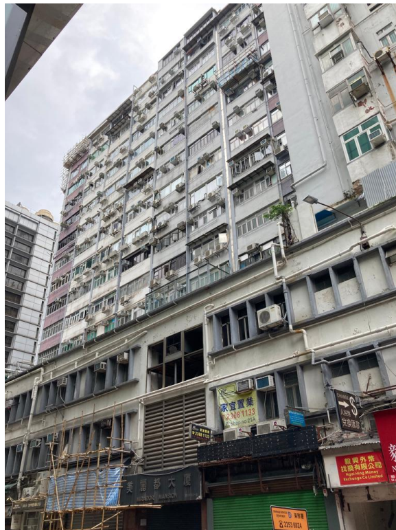
圖 4: 作為過渡性房屋的賓館外觀-位處油麻地平安大廈的賓館