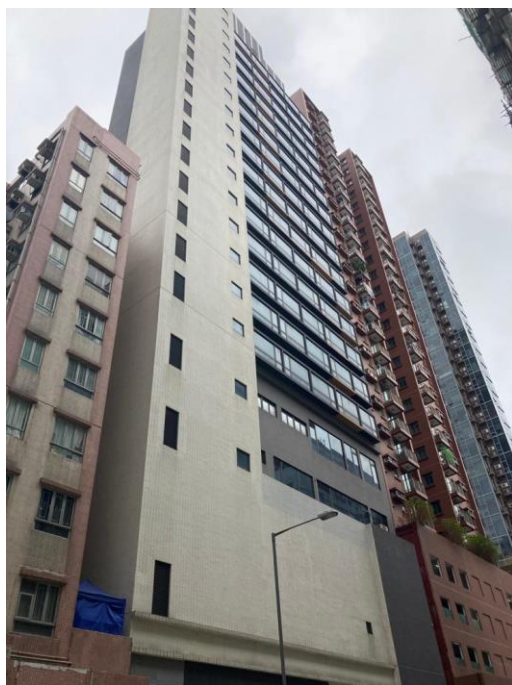
圖 2: 作為過渡性房屋的酒店/賓館外觀-KK Hotel 及王子公館