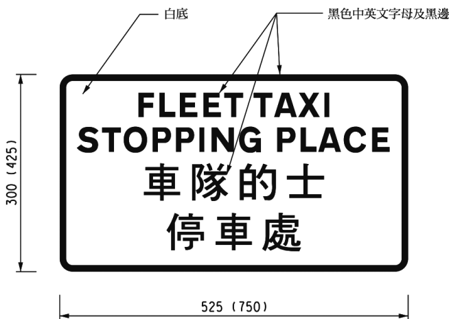
第 2 號圖形

本交通標誌如連同第 1 號圖形所示的道路標記放置，即界定根據第 30A 條指定之車隊的士停車處範圍。”。