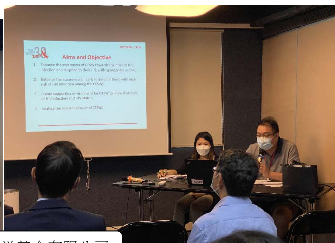
探訪關懷愛滋基金有限公司