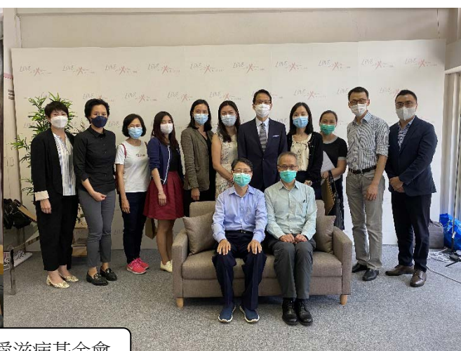
探訪香港愛滋病基金會