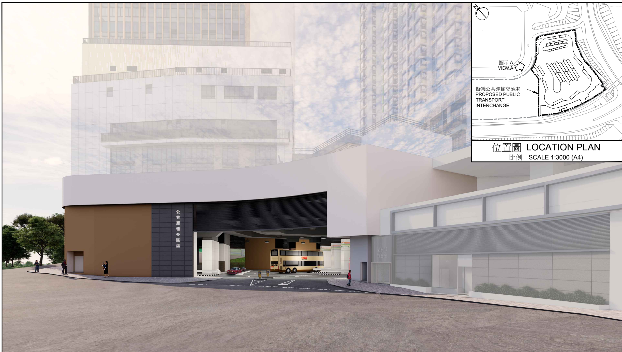
圖示A VIEW A

工程計劃項目編號B090TI 上水第4區及第30區1號用地(第二期)的公共運輸交匯處 PWP ITEM NO. B090TI PUBLIC TRANSPORT INTERCHANGE AT SHEUNG SHUI AREAS 4 AND 30 SITE 1 (PHASE 2)