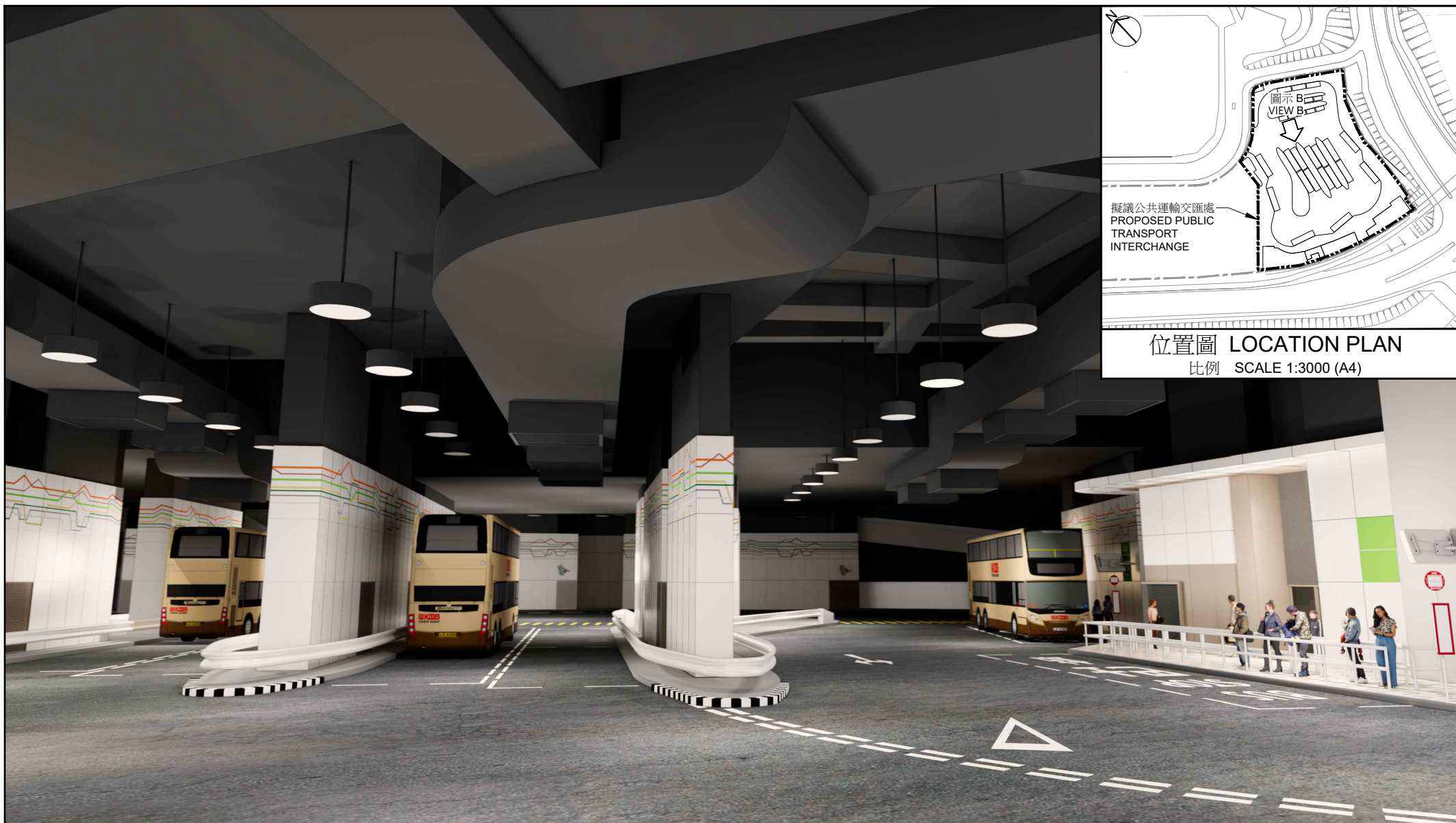
圖示B VIEW B

工程計劃項目編號B090TI 上水第4區及第30區1號用地(第二期)的公共運輸交匯處 PWP ITEM NO. B090TI