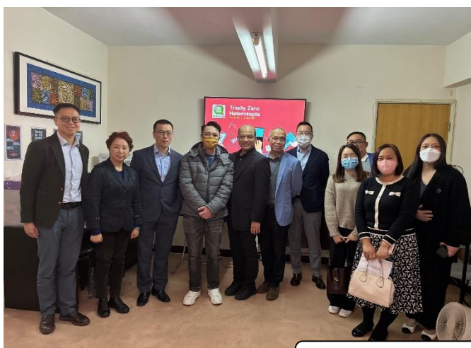
探訪 SWAN Academy Association