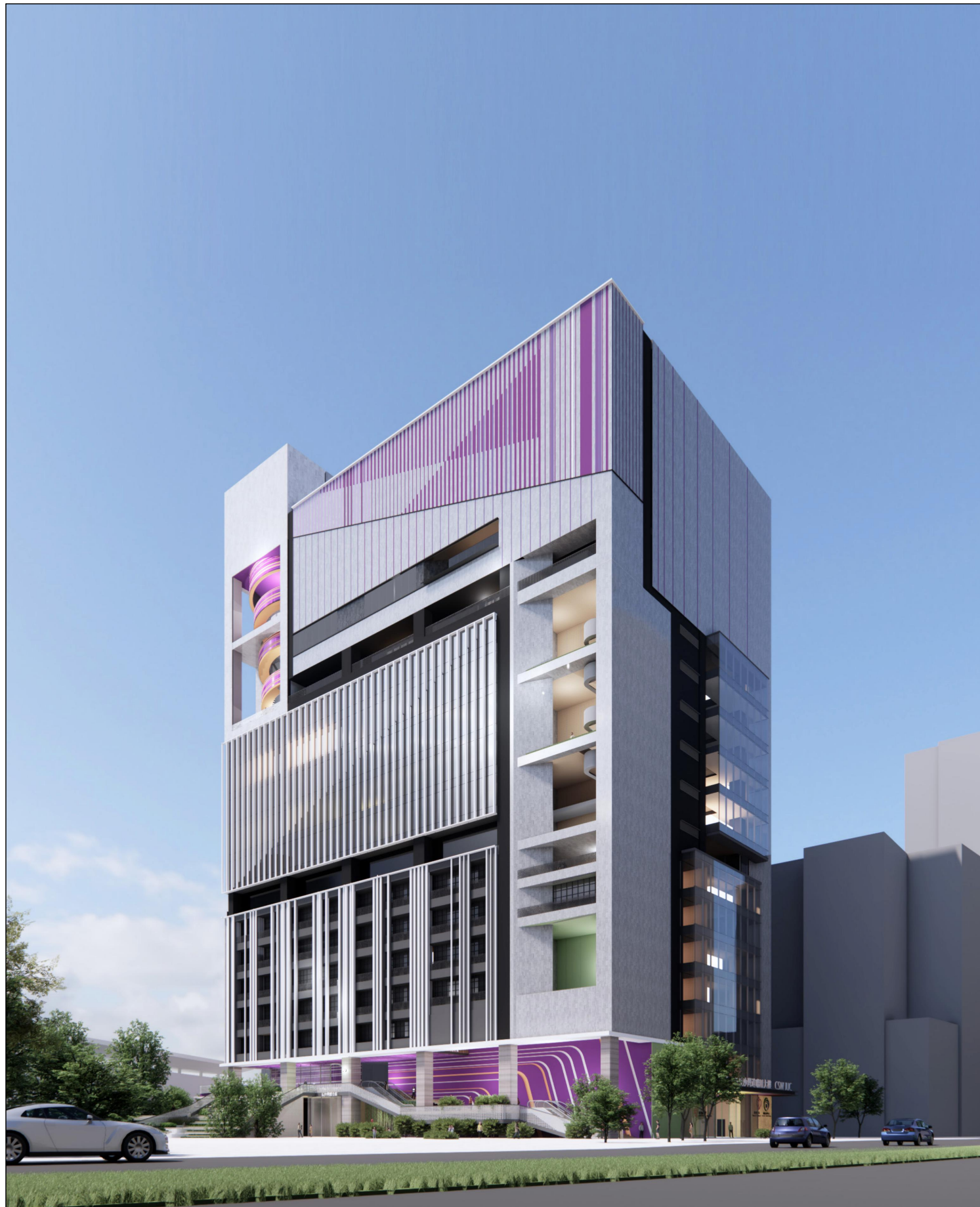
從長沙灣道望向聯用大樓的構思透視圖