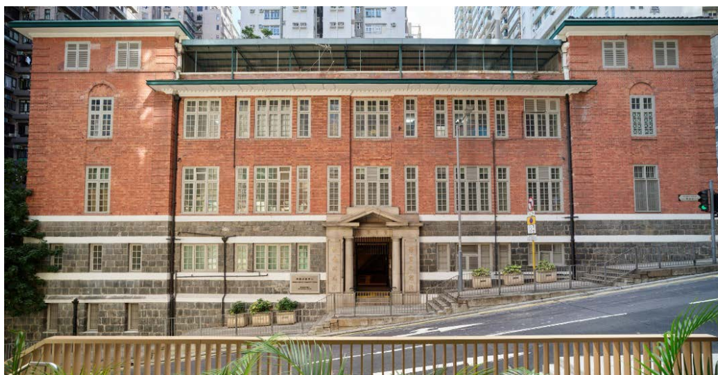
舊贊育醫院主樓正立面