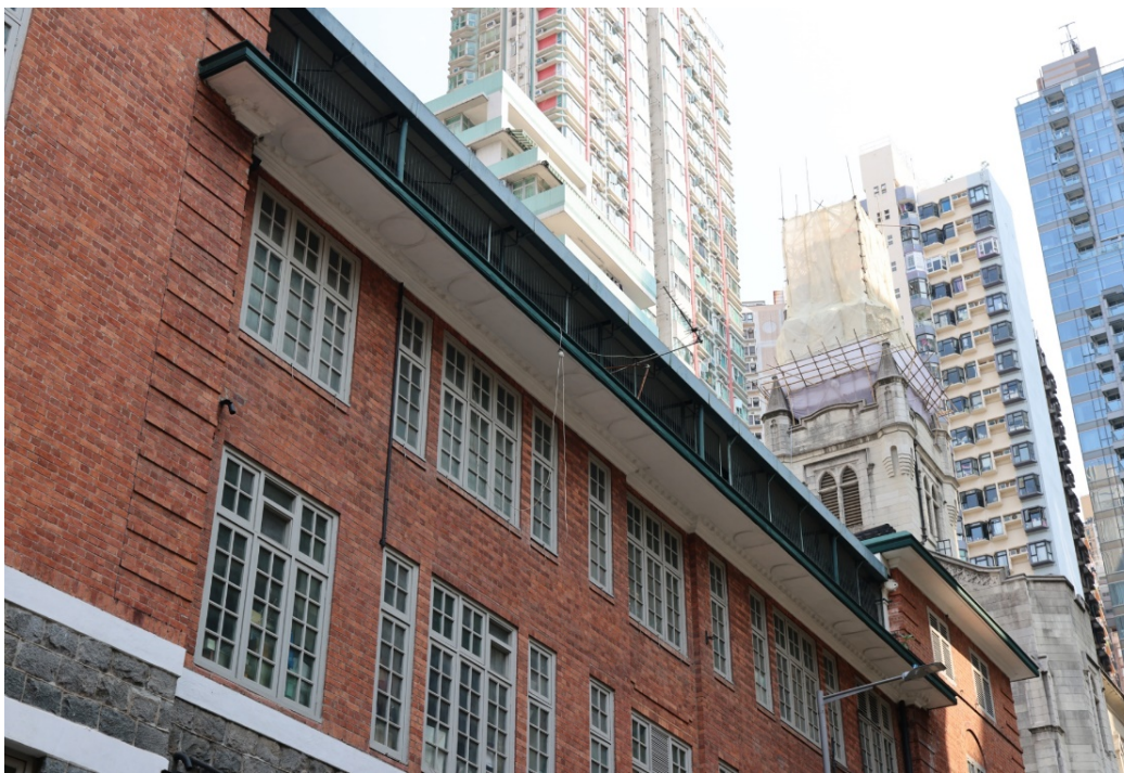
凸出的簷篷，上有齒狀飾簷口，底部是方形和圓形圖案交替的裝飾