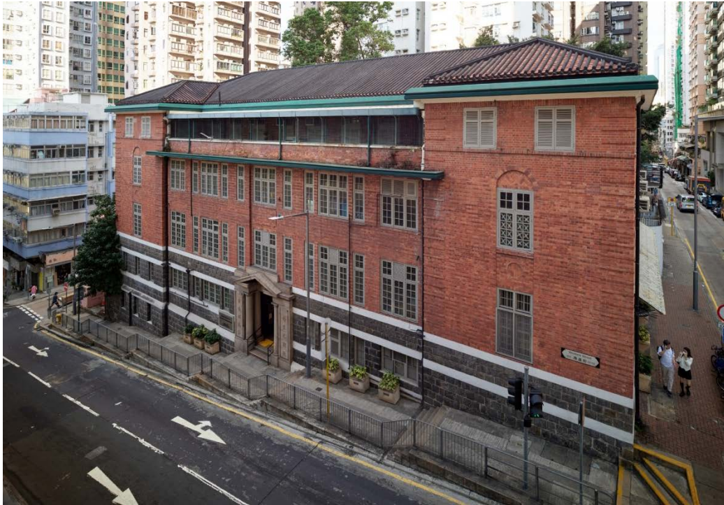
採用雙筒雙瓦鋪砌的有交叉的四坡屋頂