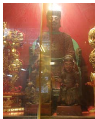
供奉神祇的正殿。正殿內的神像包括地藏王菩薩、濟公和綏靖伯。 (從左至右)