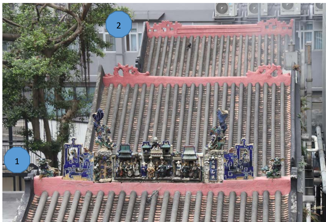
廣福祠正脊上的裝飾：