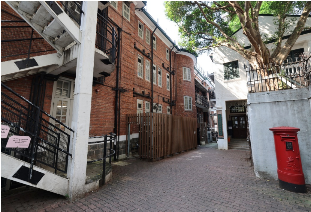
後立面連向外凸出的結構