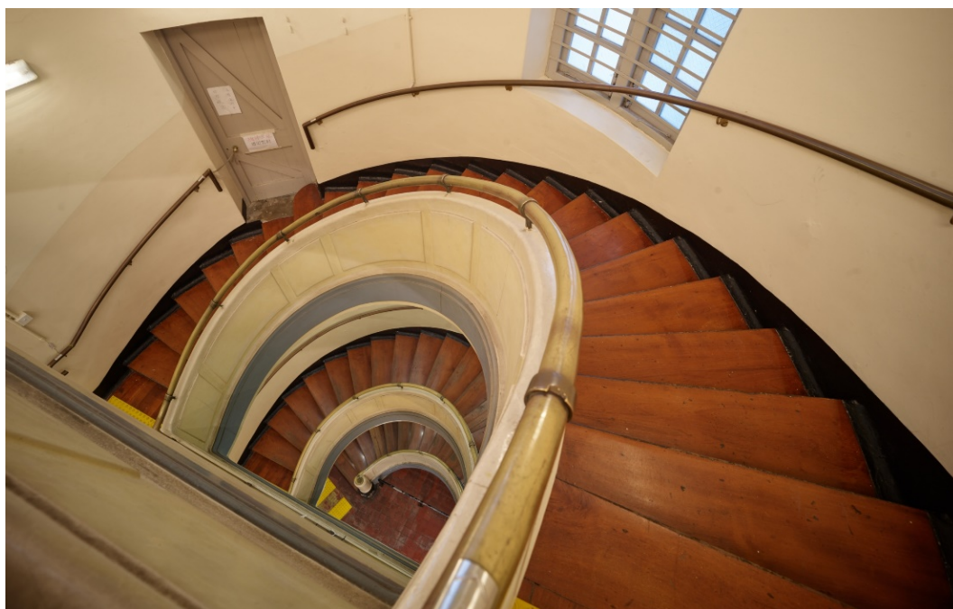
螺旋形主樓梯連混凝土欄杆及金屬扶手