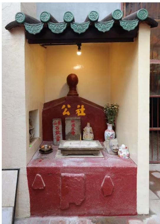
高台下層的土地神壇