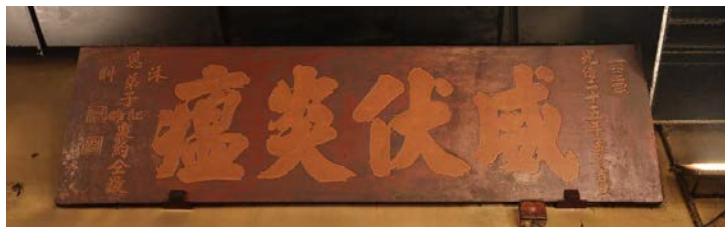
來自其他廟宇的文物，例如「虎頭門」(左) 及「威伏炎瘟」牌匾（右）