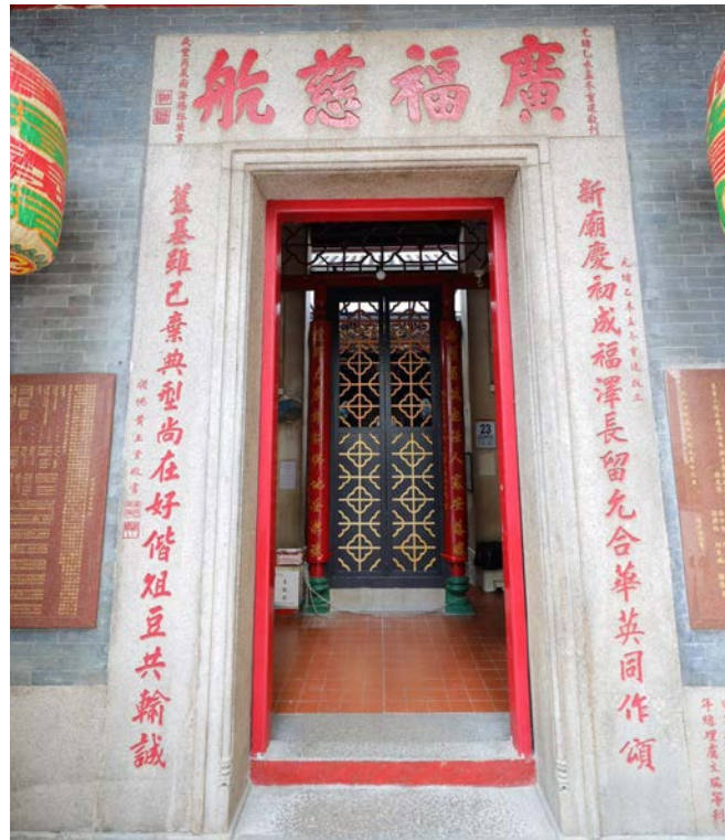
正門的花崗石門楣和兩側的花崗石楹聯