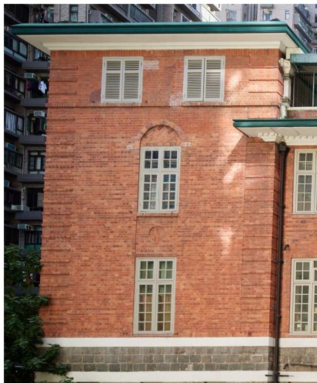
暗拱、暗小圓窗及牆角隅石