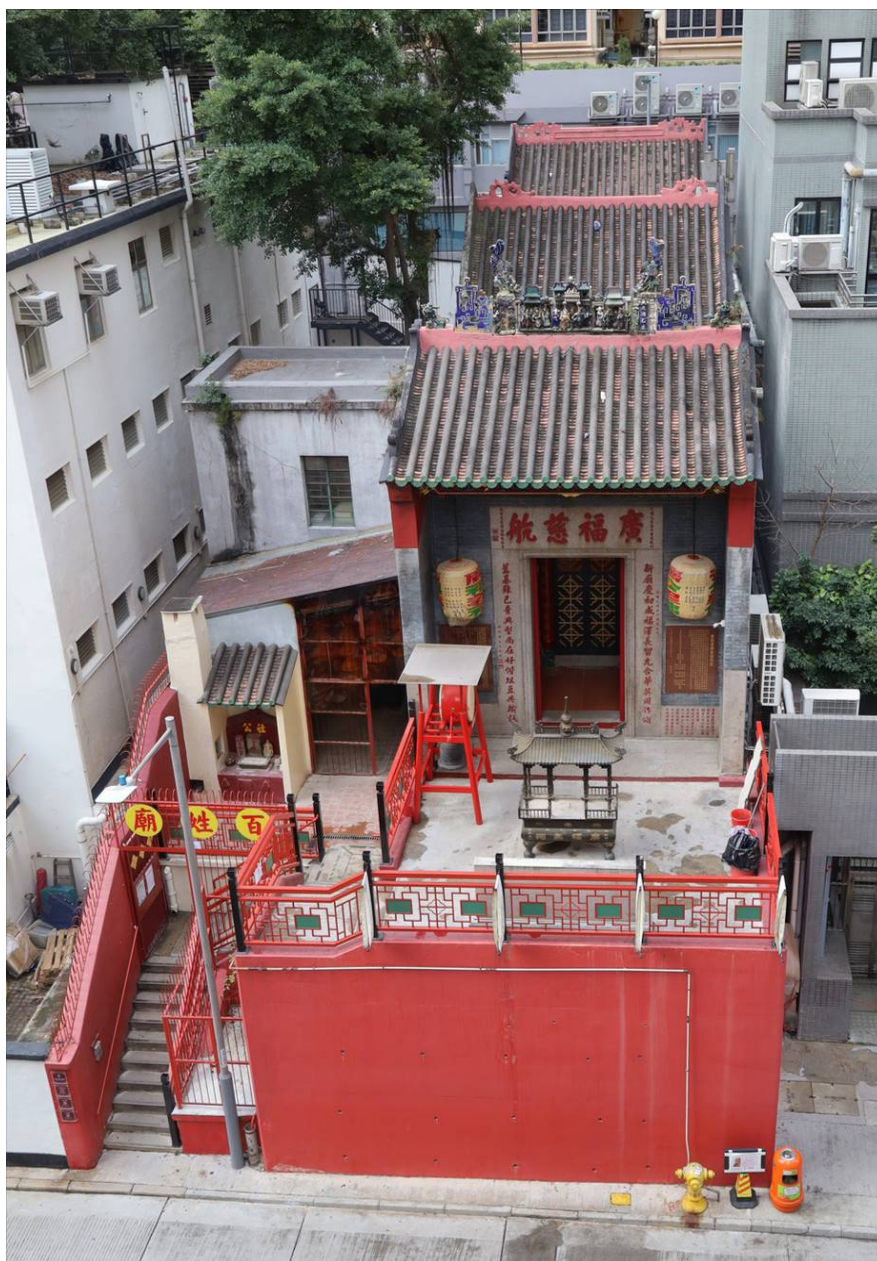
廣福祠鳥瞰圖，顯示三進兩院的格局連高台上的前院。