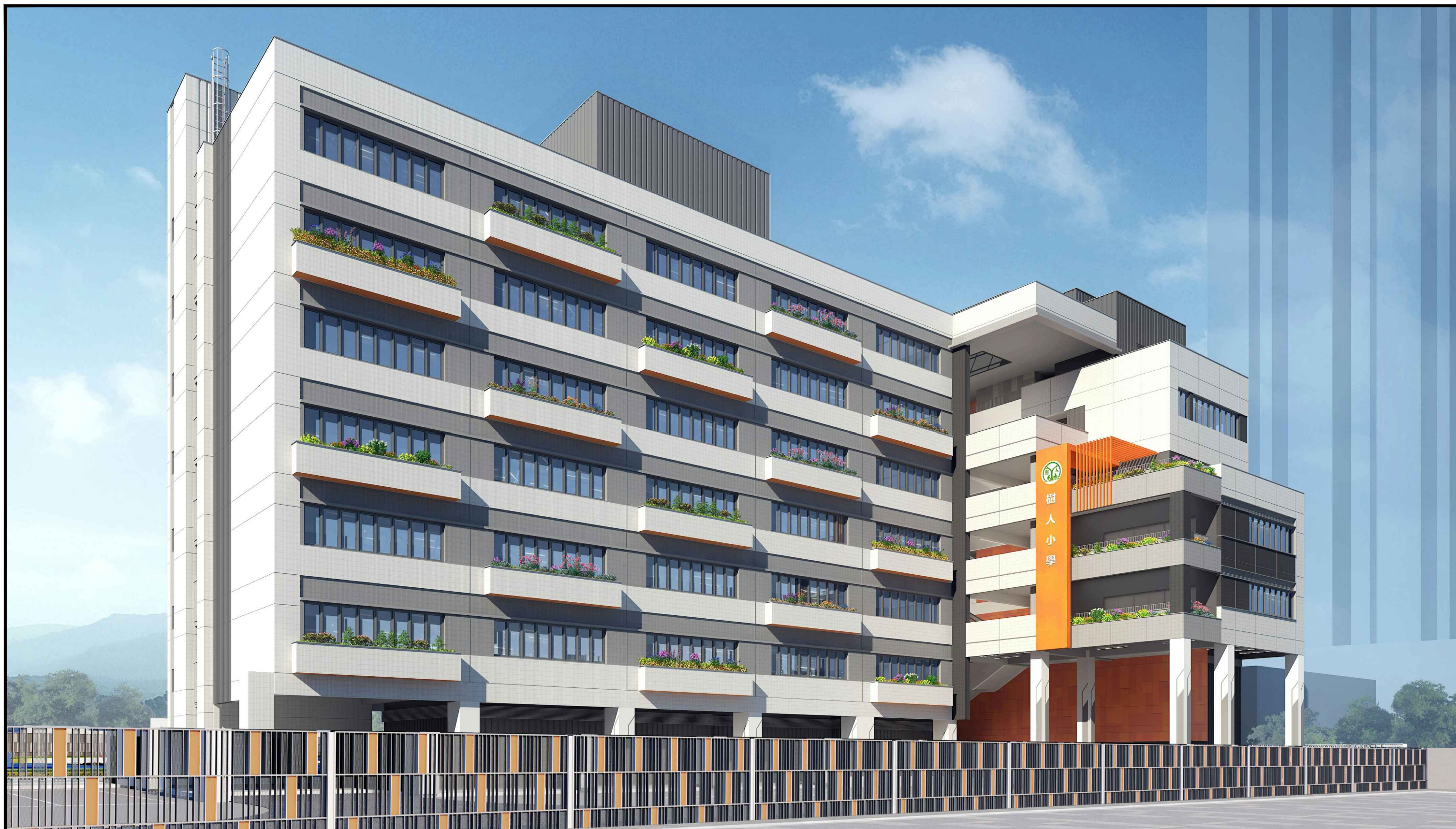
從南面望向小學的構思透視圖