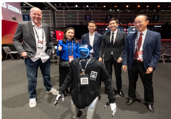
立法會Web3及虛擬資產發展事宜小組委員會於2025年2月20日參觀被譽為全球最大型加密貨幣和Web3國際會議的Consensus香港大會