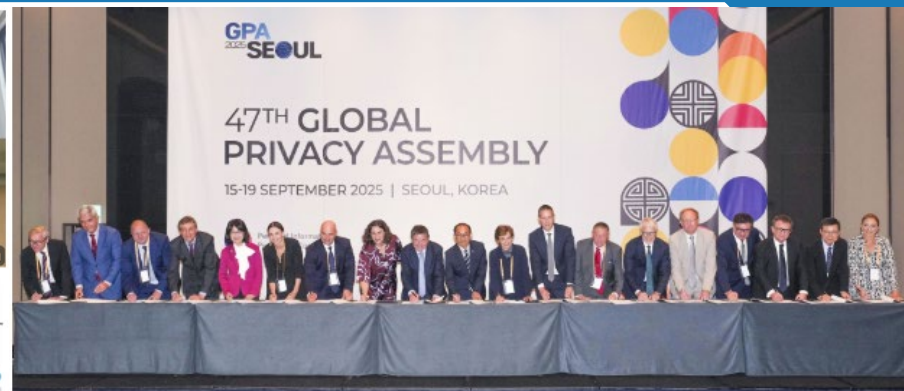
香港私隱專員與其他19個私隱或資料保障機構簽署《AI環球聯合聲明》