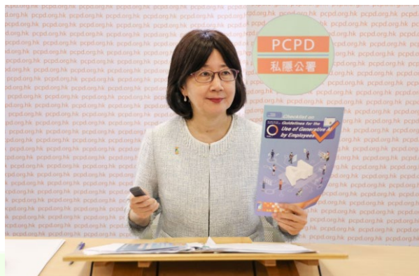
香港私隱專員向亞太區私隱機構成員解釋《僱員使用生成式AI的指引清單》