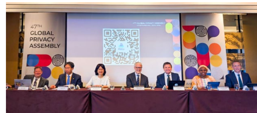
香港私隱專員出席第47屆環球私隱議會